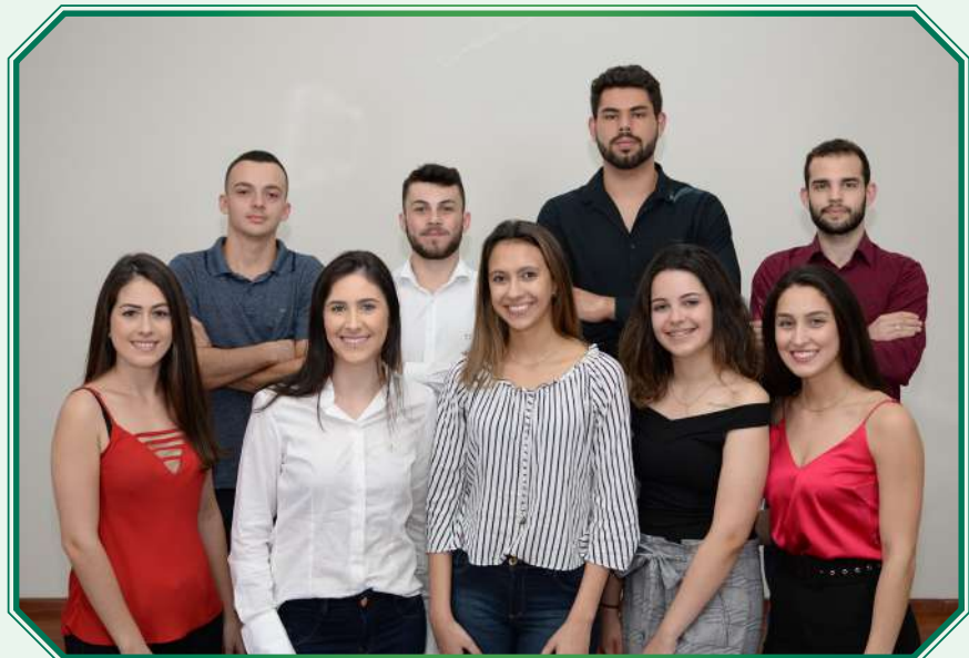
Centro Acadêmico (CA) atual