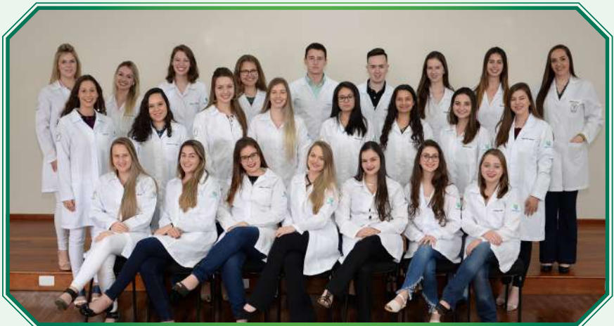
Turma 2º ano