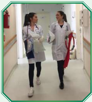
Prática e estágio supervisionado no Hospital Universitário Santa Terezinha (HUST)