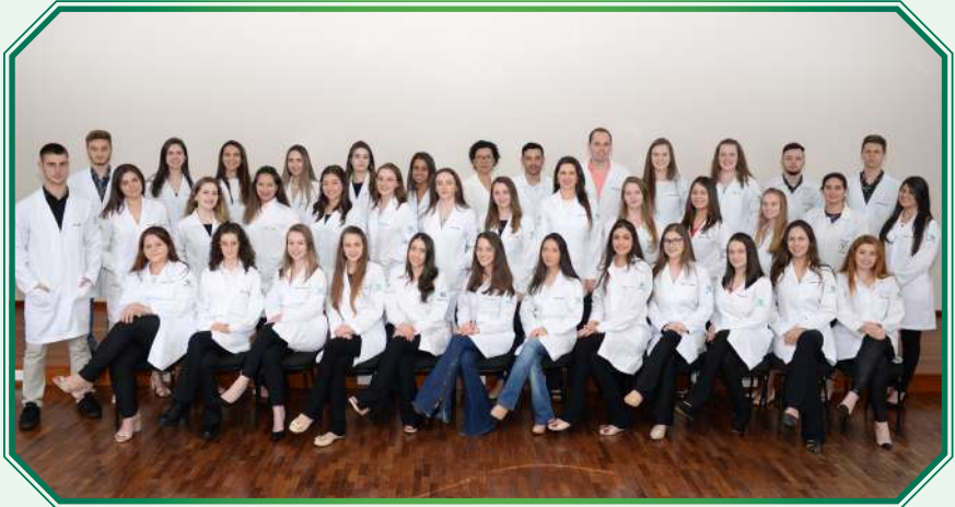
Turma 1º ano