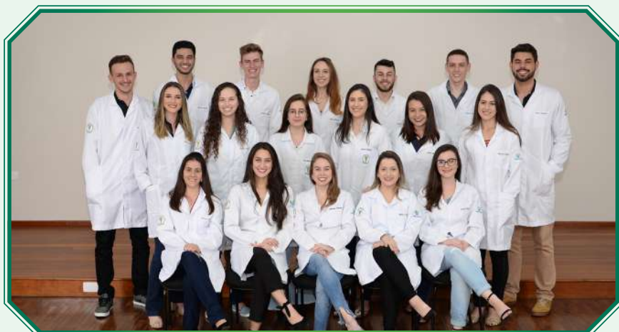
Turma 4º ano