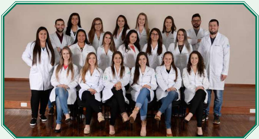
Turma 5º ano