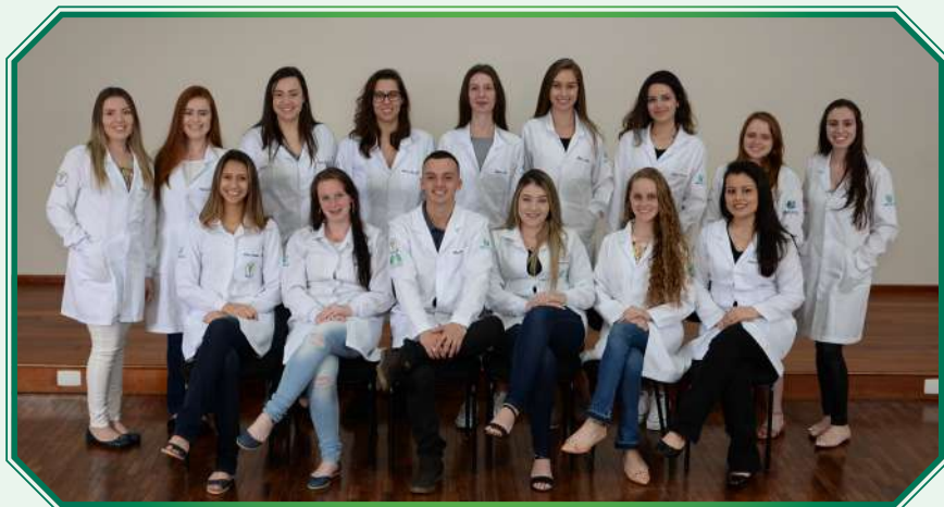
Turma 3º ano