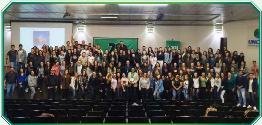
XXII Semana Acadêmica de Fisioterapia 2019

Os acadêmicos do Curso de Fisioterapia são reconhecidos por uma estreita relação e estima com o Curso. O Centro Acadêmico (CA) é bastante ativo e, além dele, existe a Associação Atlética Acadêmica de Fisioterapia de Joaçaba (Atlética), os quais aproximam os laços entre acadêmicos e professores.