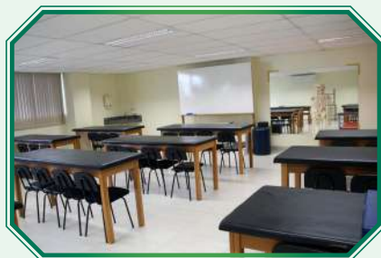
Clínica-Escola de Pesquisa e Atendimento em Fisioterapia (CEPAF)