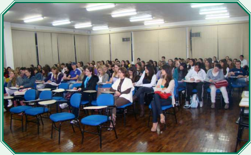
Dia do fisioterapeuta - 2011

O Curso de Fisioterapia da Unoesc de Joaçaba formou até o momento 13 turmas do período diurno e 5 do período noturno, proporcionando ao mercado de trabalho 472 fisioterapeutas generalistas qualificados para o exercício profissional.