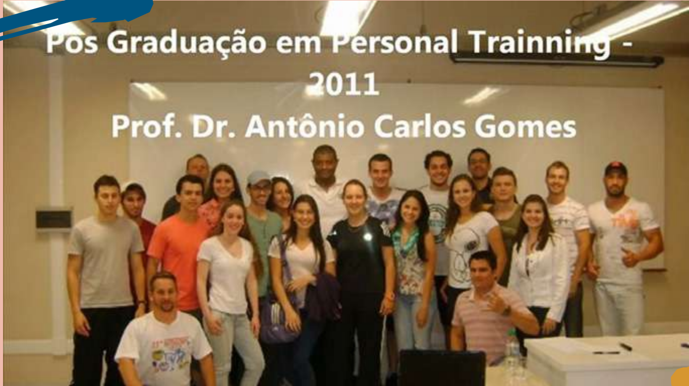
2011 – Turma de Pós-graduação em Personal Training.