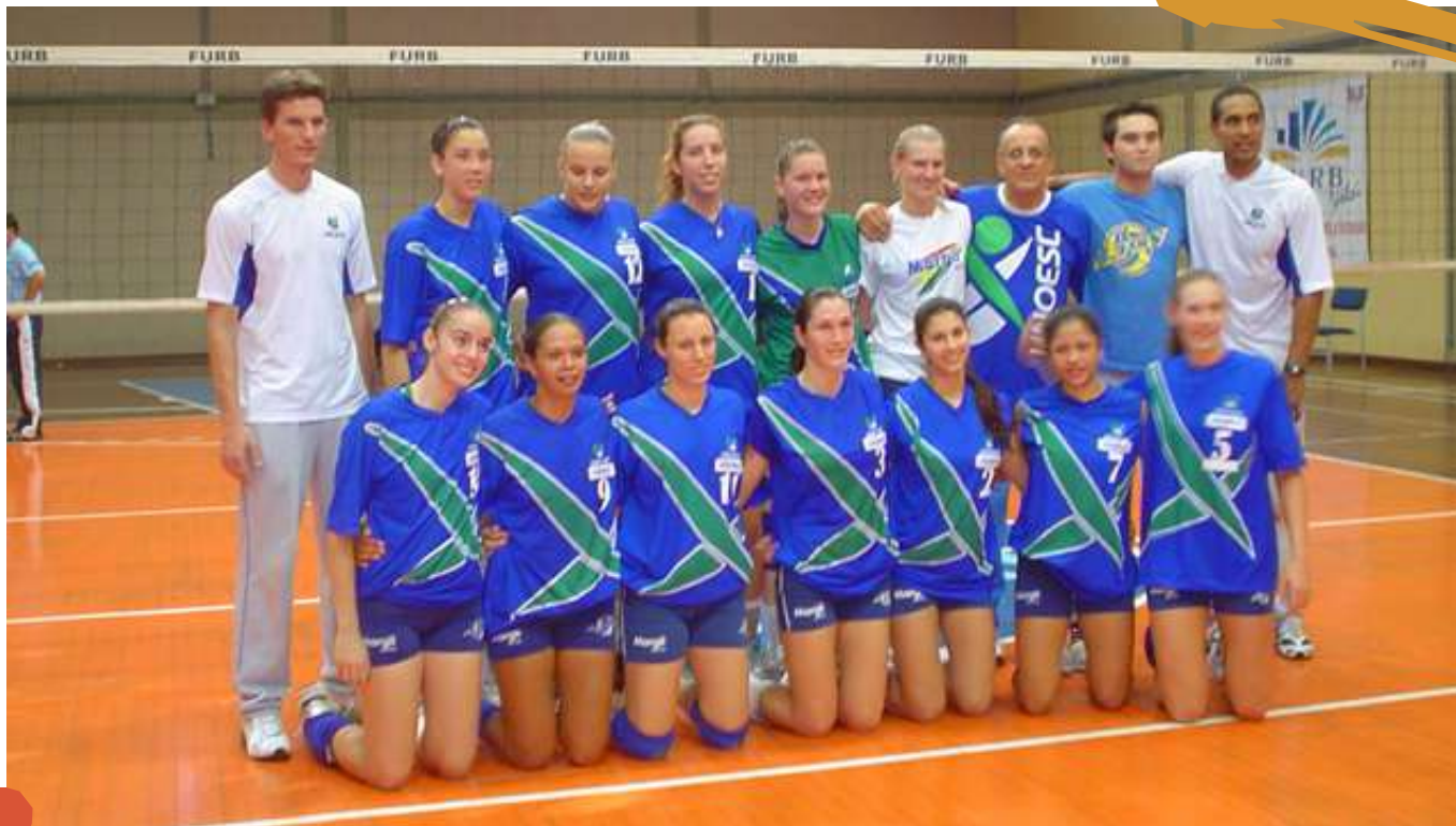
2007 – Equipe de voleibol feminino nos Jogos Universitários Catarinenses. Blumenau, SC.