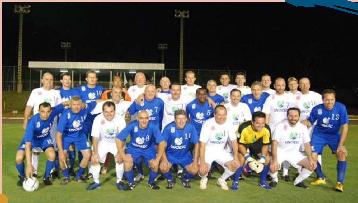
2015 – Reinauguração do Campo de Futebol no campus II.