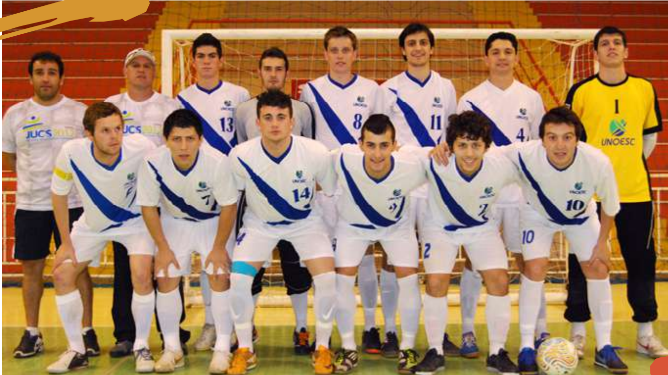
2012 – Equipe de futsal masculino. Jogos Universitários Catarinenses. Joaçaba, SC.