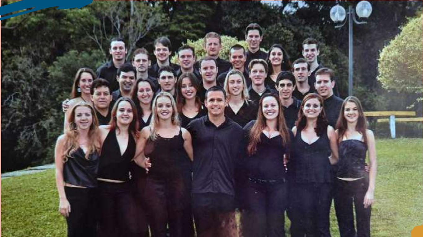
2006 – Turma de diplomados do Curso, 2º semestre.