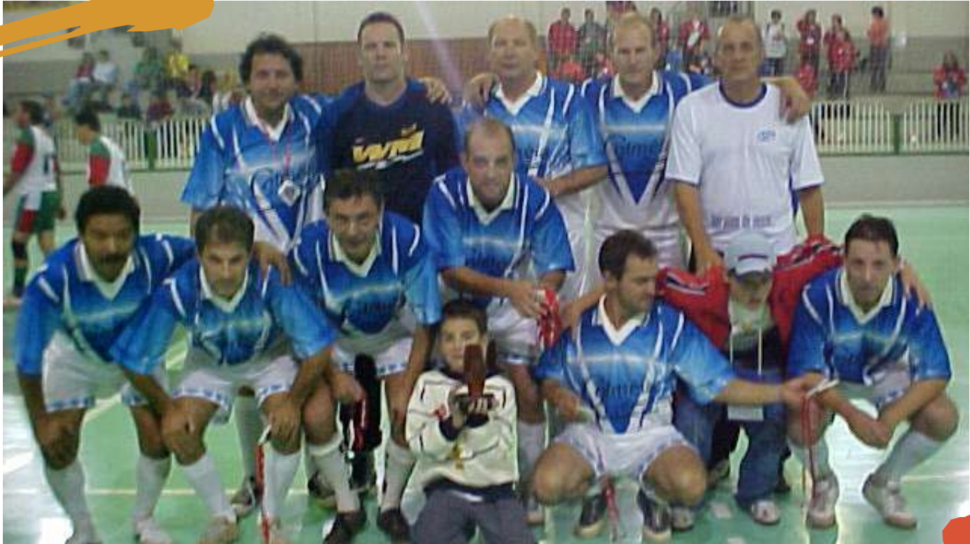
2003 – Final do futsal masculino. Cofafe, Lages, SC.