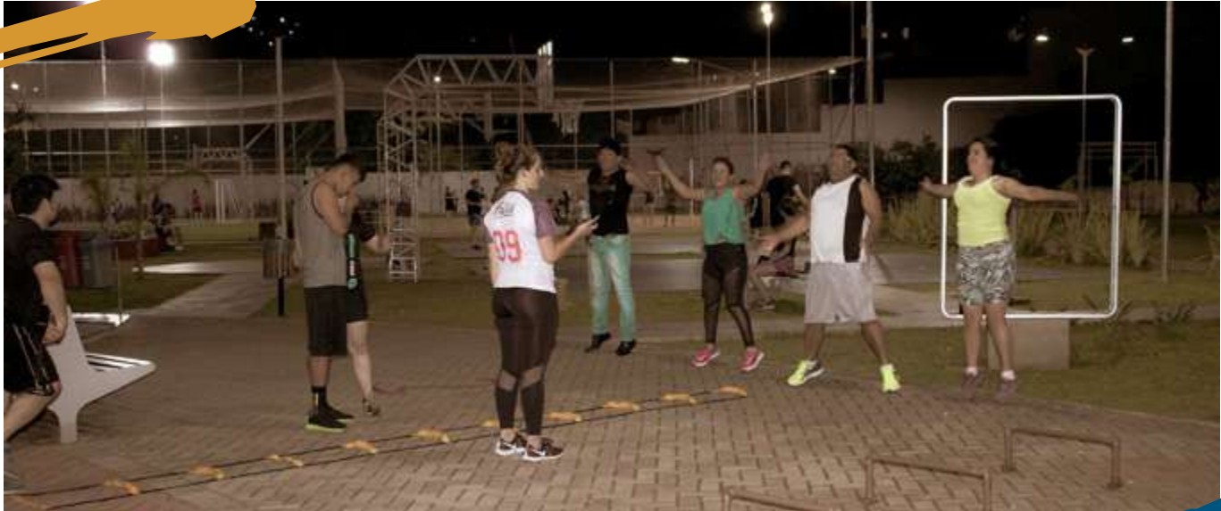
Atividade Prática de Ensino.