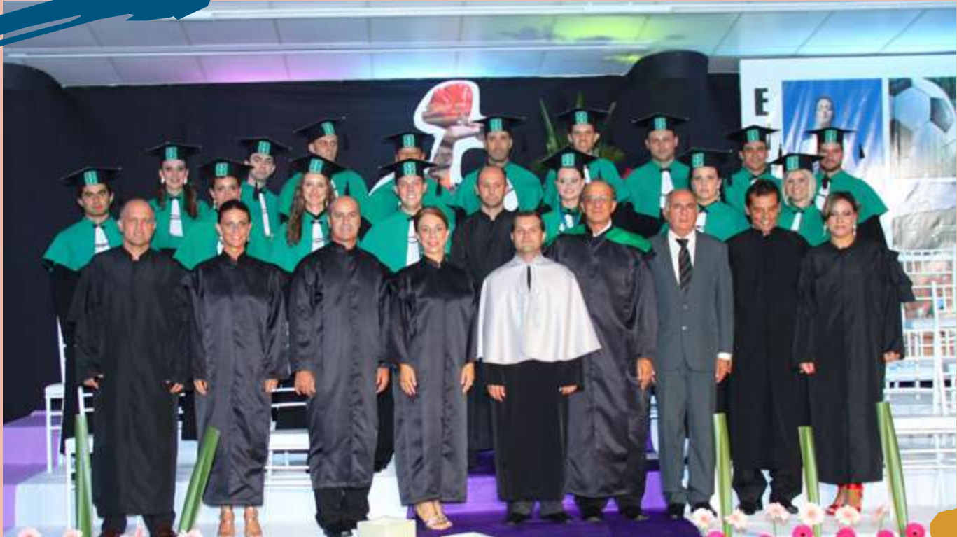
2011 – Turma de diplomados do Curso.