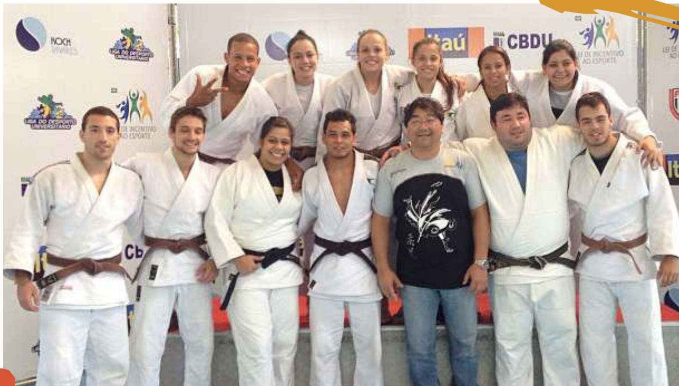
2013 – Equipe de judô. Liga de Desporto Universitário. São Paulo, SP.