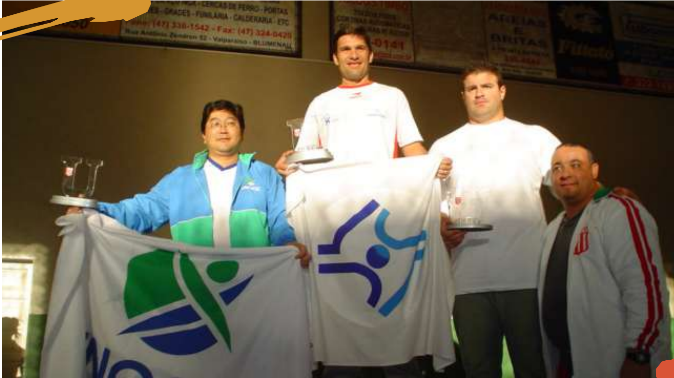
2007 – Premiação do judô masculino nos Jogos Universitários Catarinenses. Blumenau, SC.