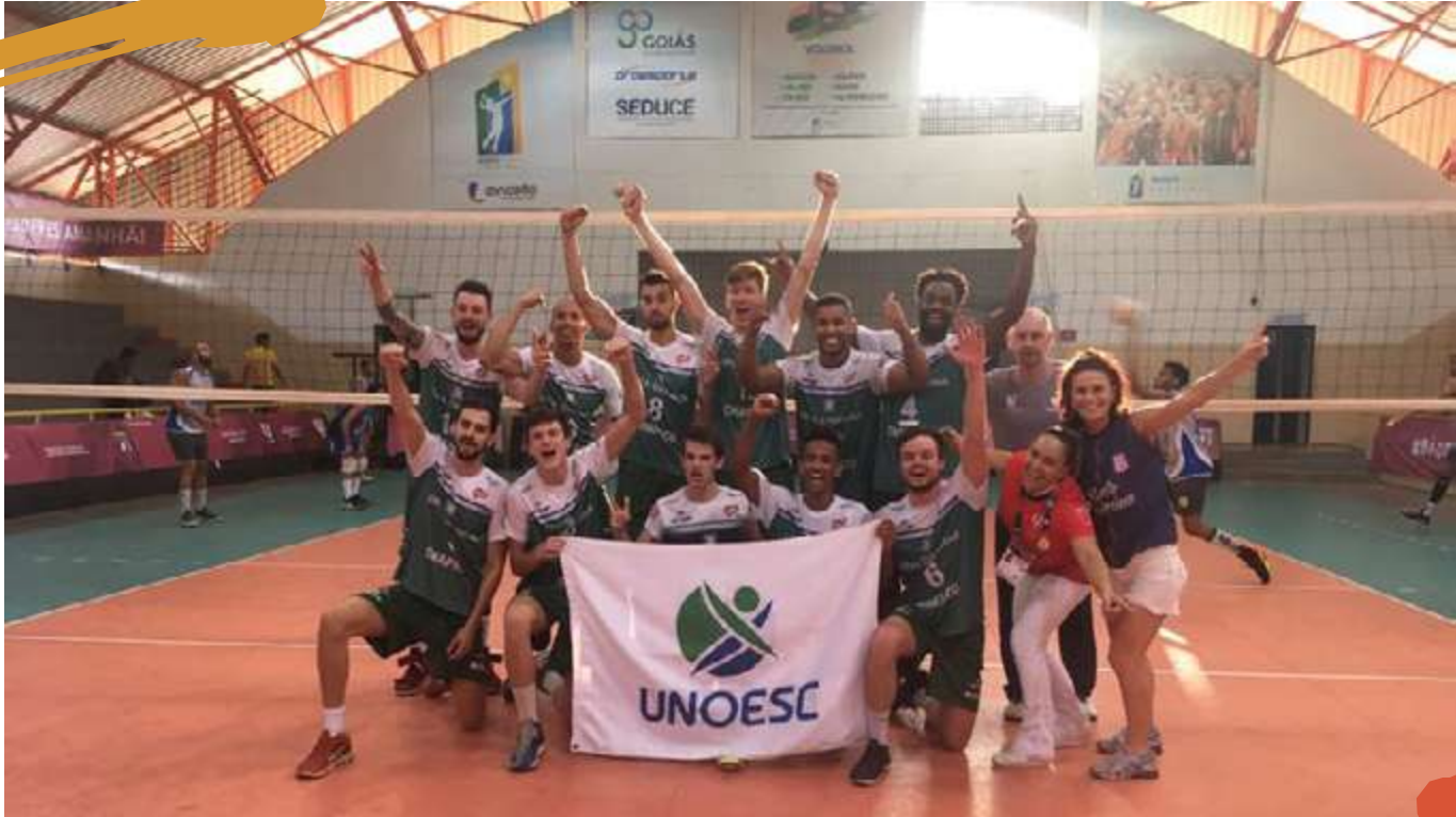
2017 – Equipe de voleibol masculino, campeã dos Jogos Universitários Brasileiros (JUBs). Goiânia, GO.