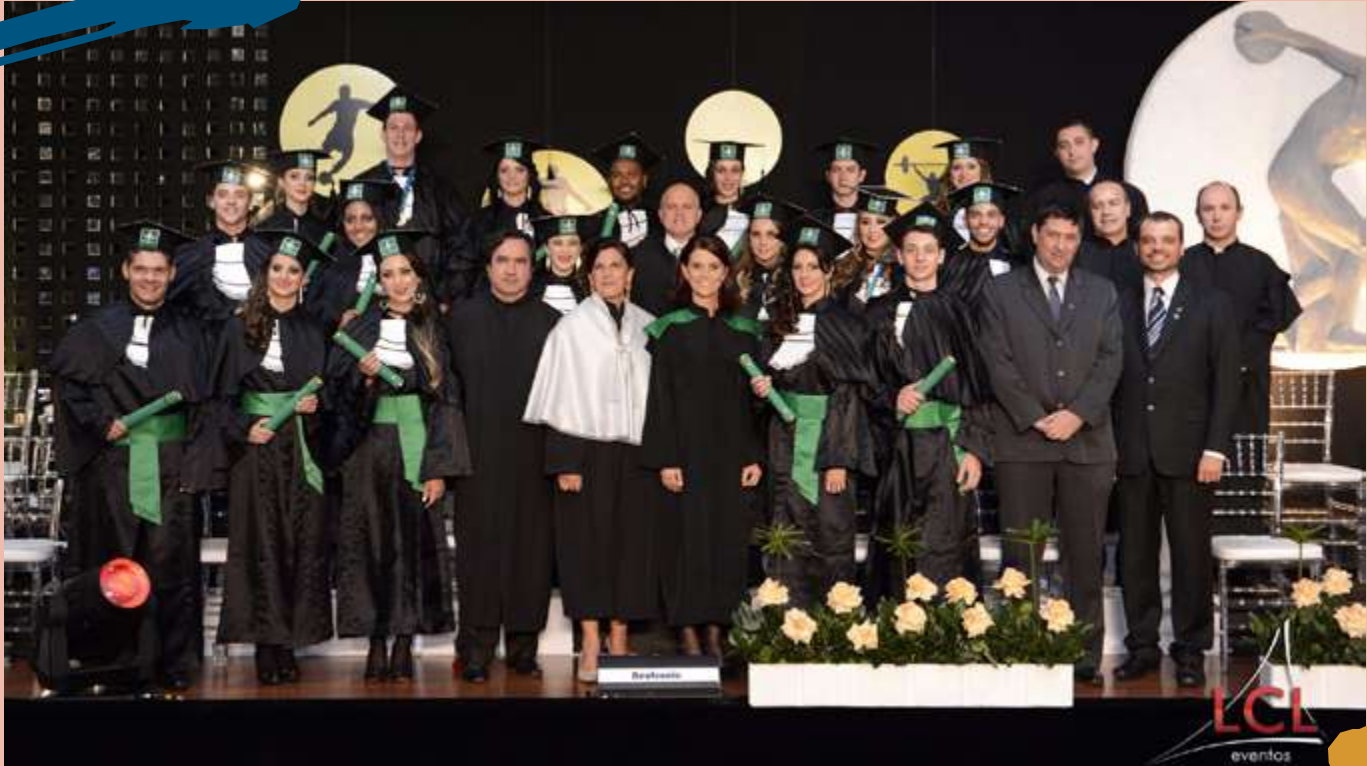
2015 – Turma de diplomados do Curso.