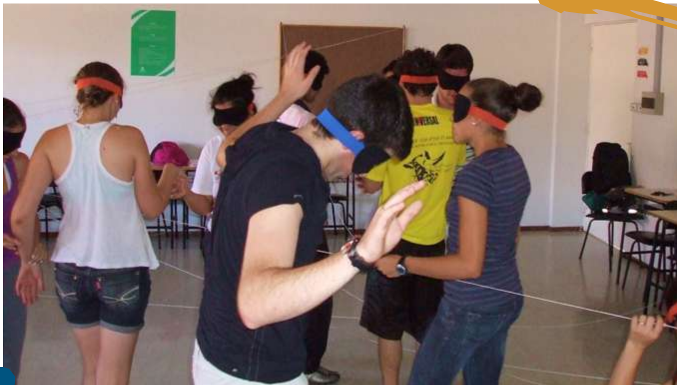
2012 – Educação Física Adaptada.