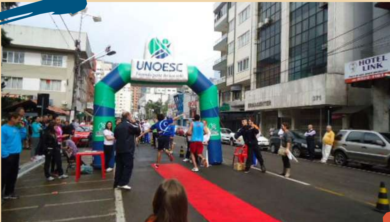
2015 – Corrida Rústica 7 km, Luzerna a Joaçaba.