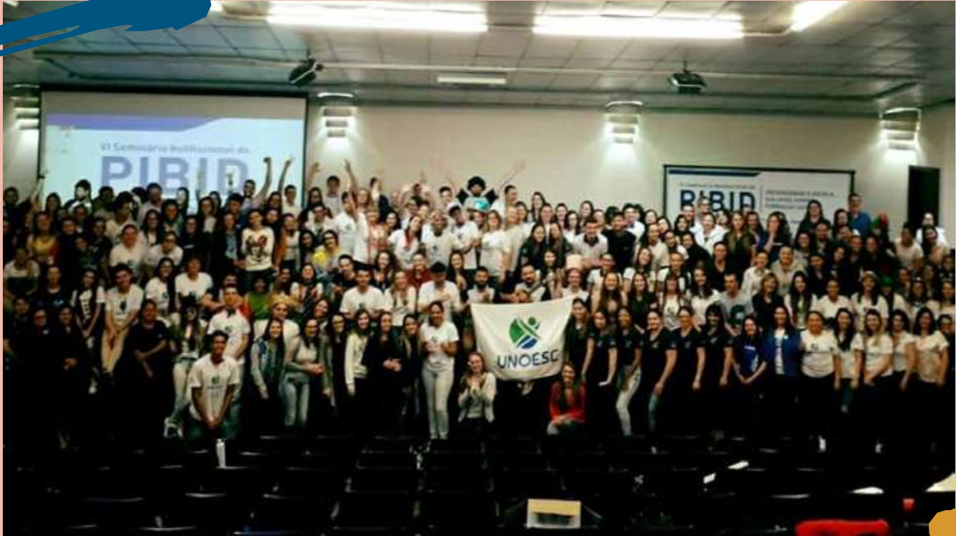
2015 – Seminário Institucional do Pibid realizado em Joaçaba.