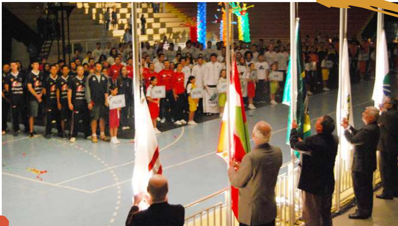
2012 – Cerimonial de Abertura dos Jogos Universitários Catarinenses. Joaçaba, SC.