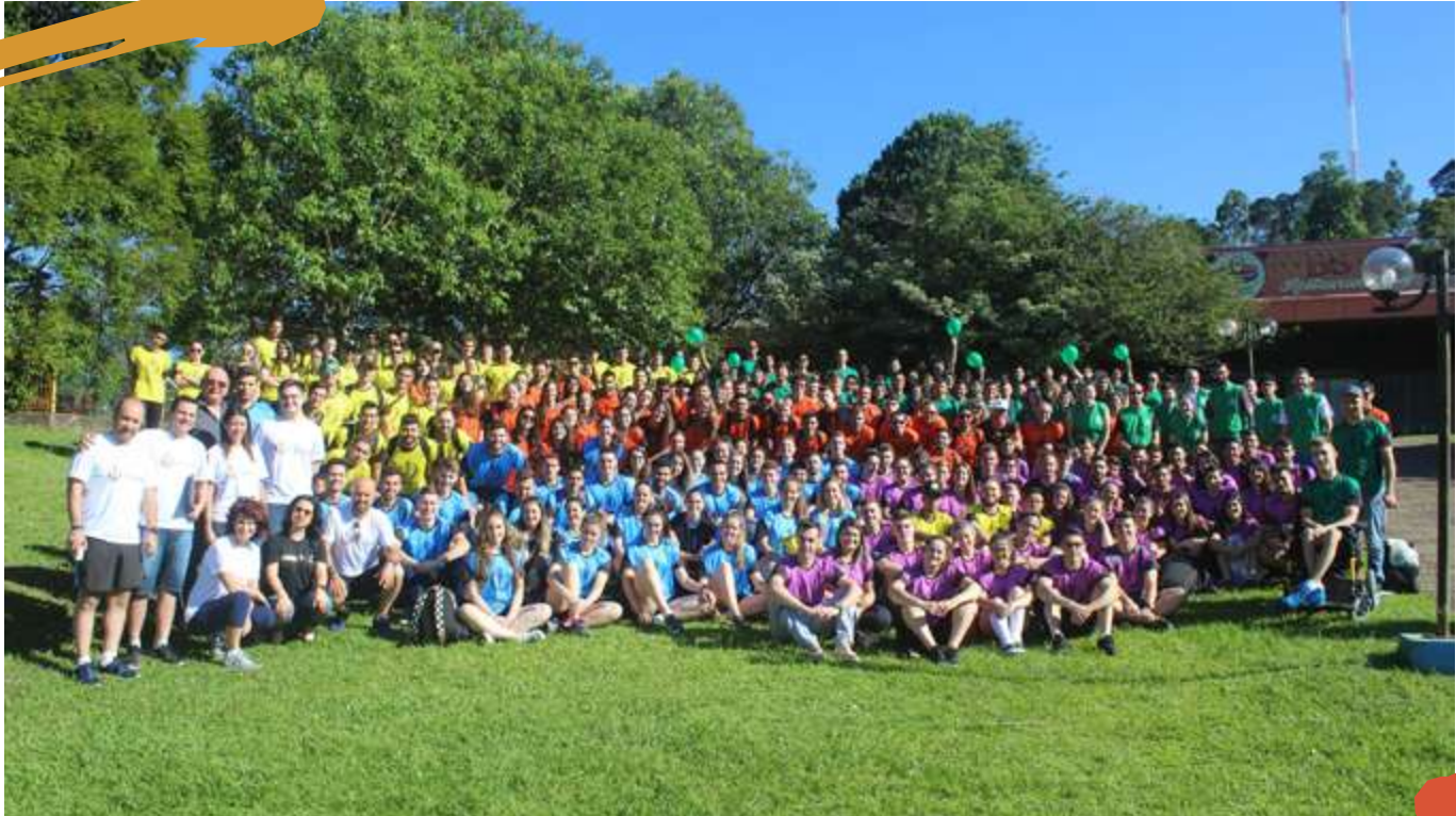
2018 – 1º Jogos Intercampi, Joaçaba, SC.