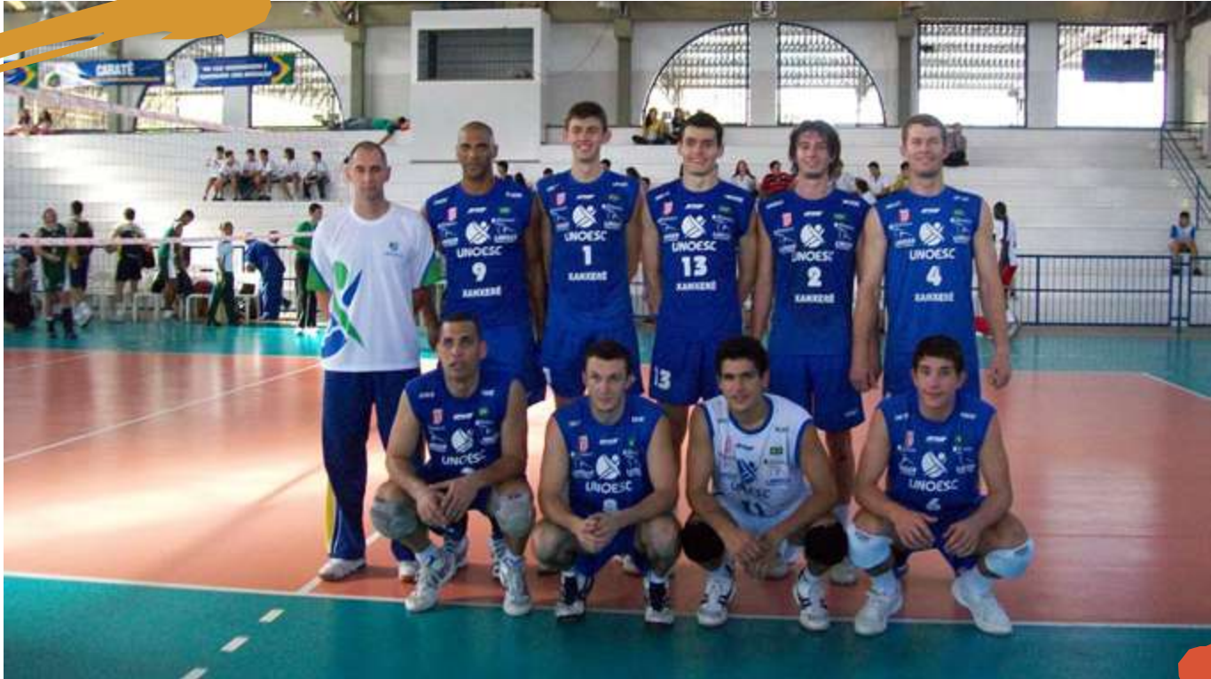
2009 – Equipe de voleibol masculino. Jogos Universitários Brasileiros, Fortaleza, CE.