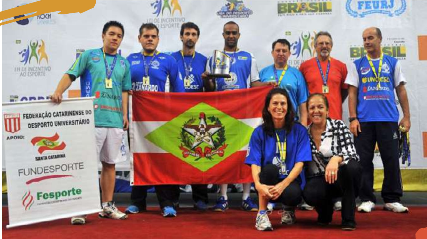
2013 – Equipe de handebol masculino. Liga de Desporto Universitário. Volta Redonda, RJ.