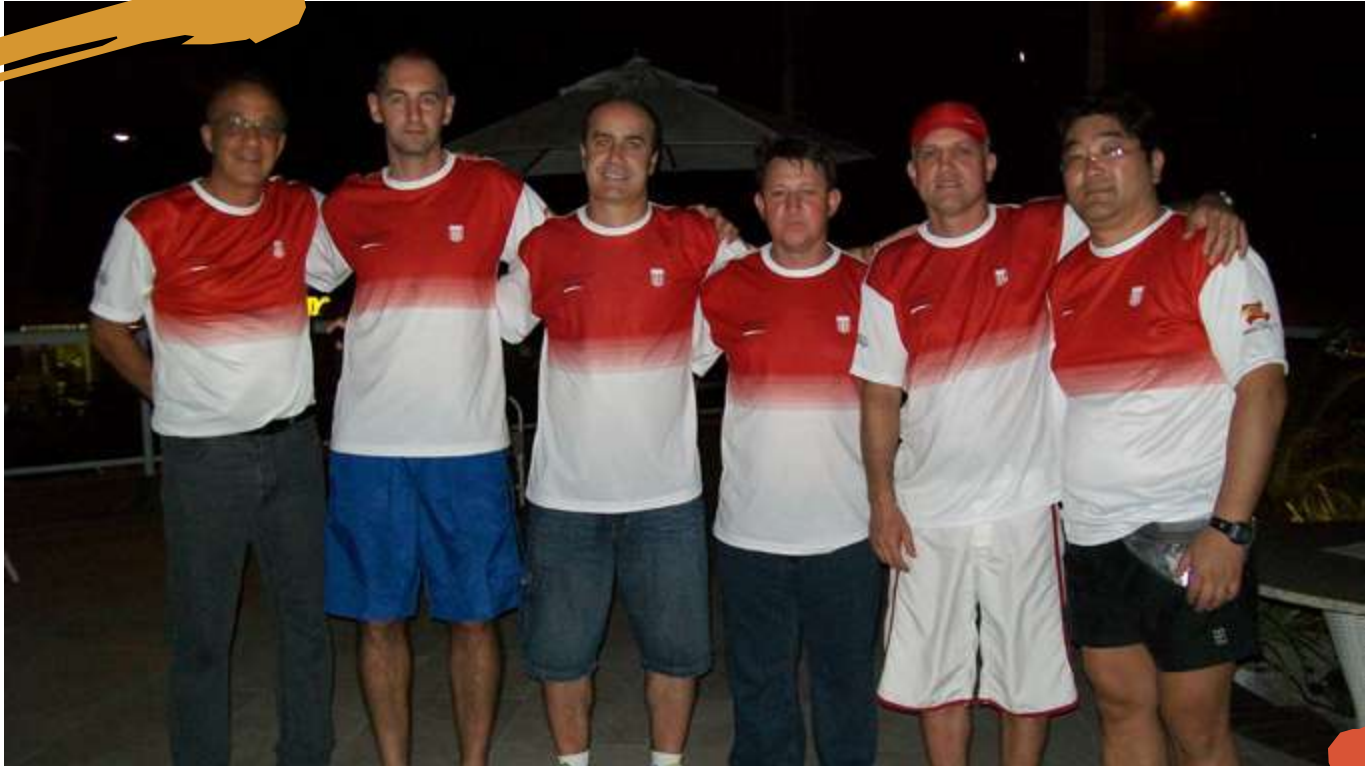
2009 – Professores e auxiliares da Delegação da Unoesc. Jogos Universitários Brasileiros, Fortaleza, CE.