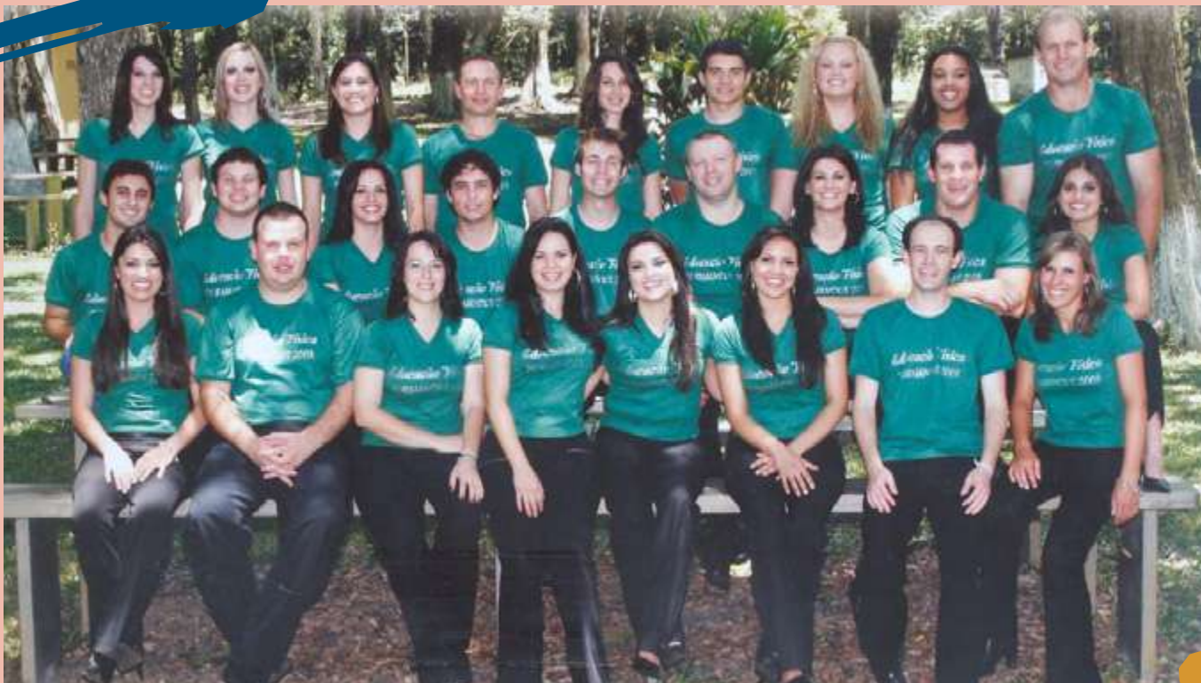
2008 – Turma de diplomados do Curso.