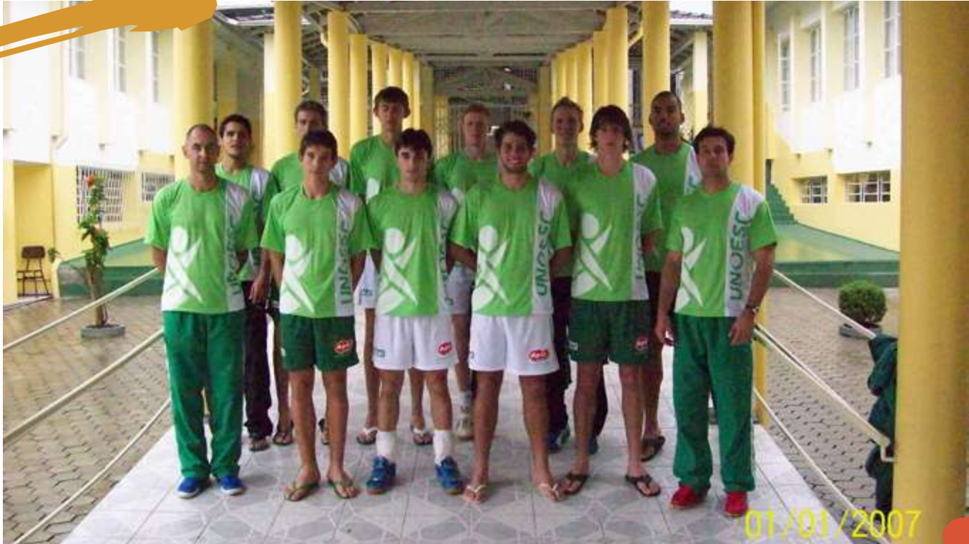
2008 – Equipe de voleibol masculino. Jogos Universitários Catarinenses, Jaraguá do Sul, SC.