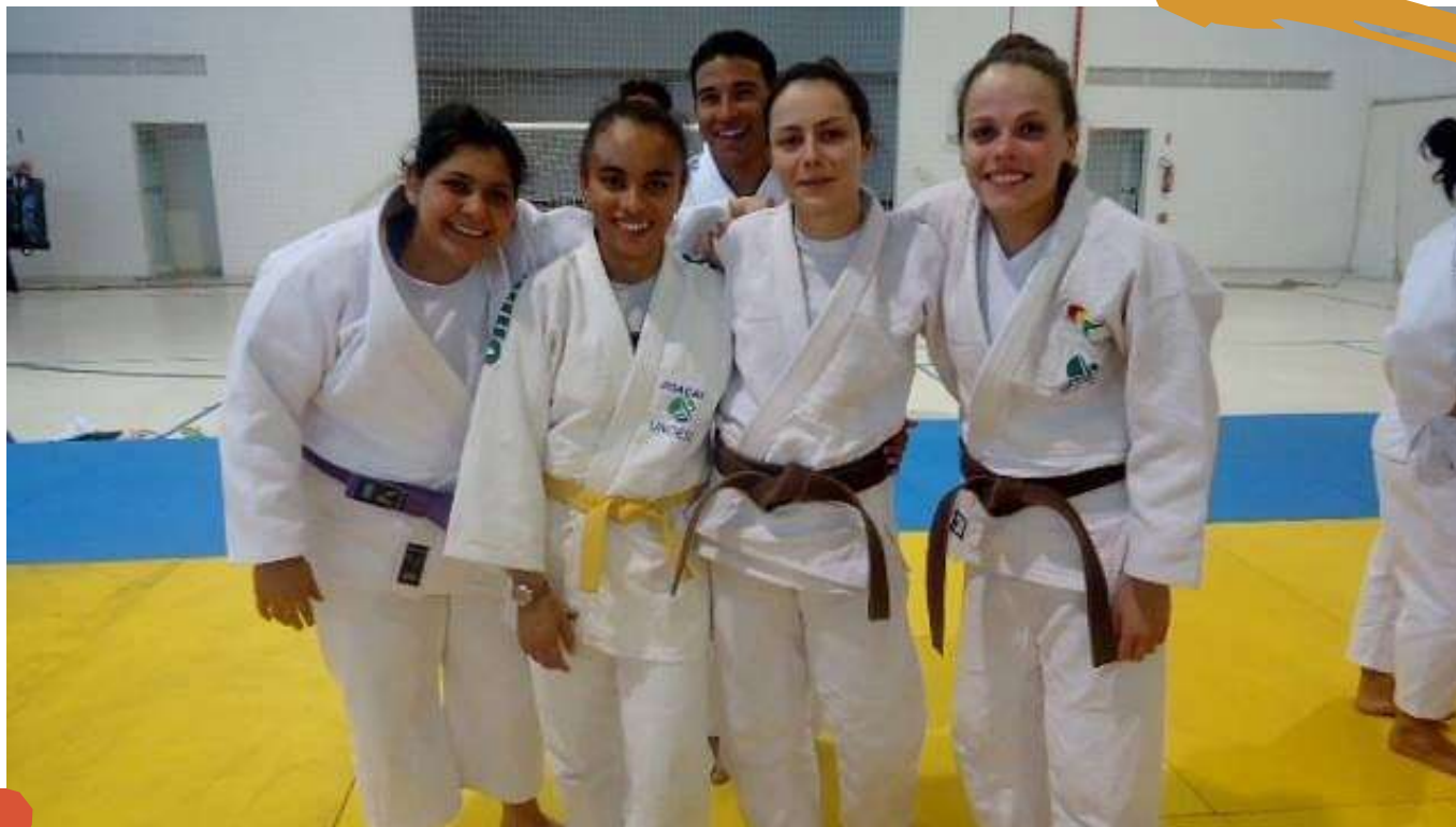
2011 – Equipe de judô. Jogos Universitários Catarinenses, Tubarão, SC.