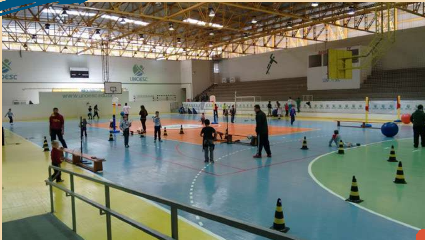
Unoesc Abraça – Evento esportivo social e cultural para adolescentes.