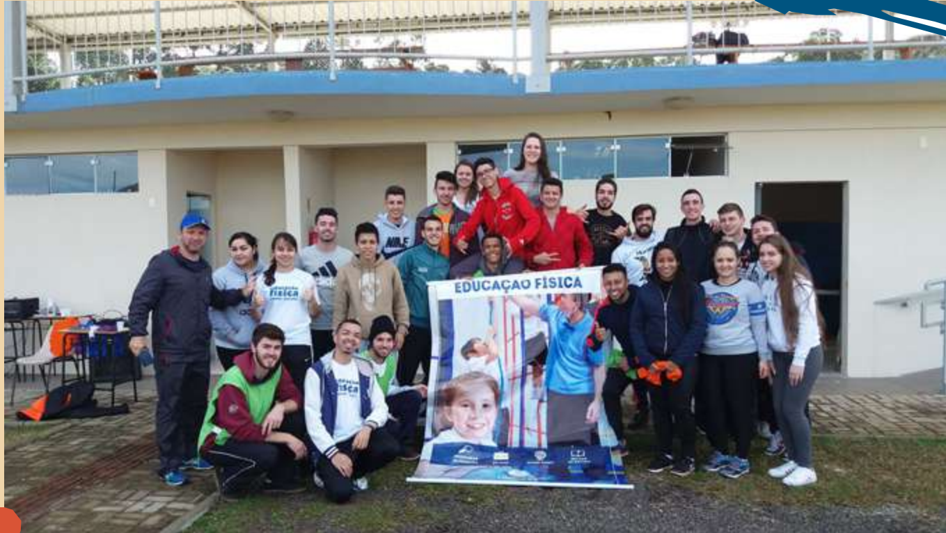
2017 – Festival de Atletismo – Alunos do Curso de Educação Física.