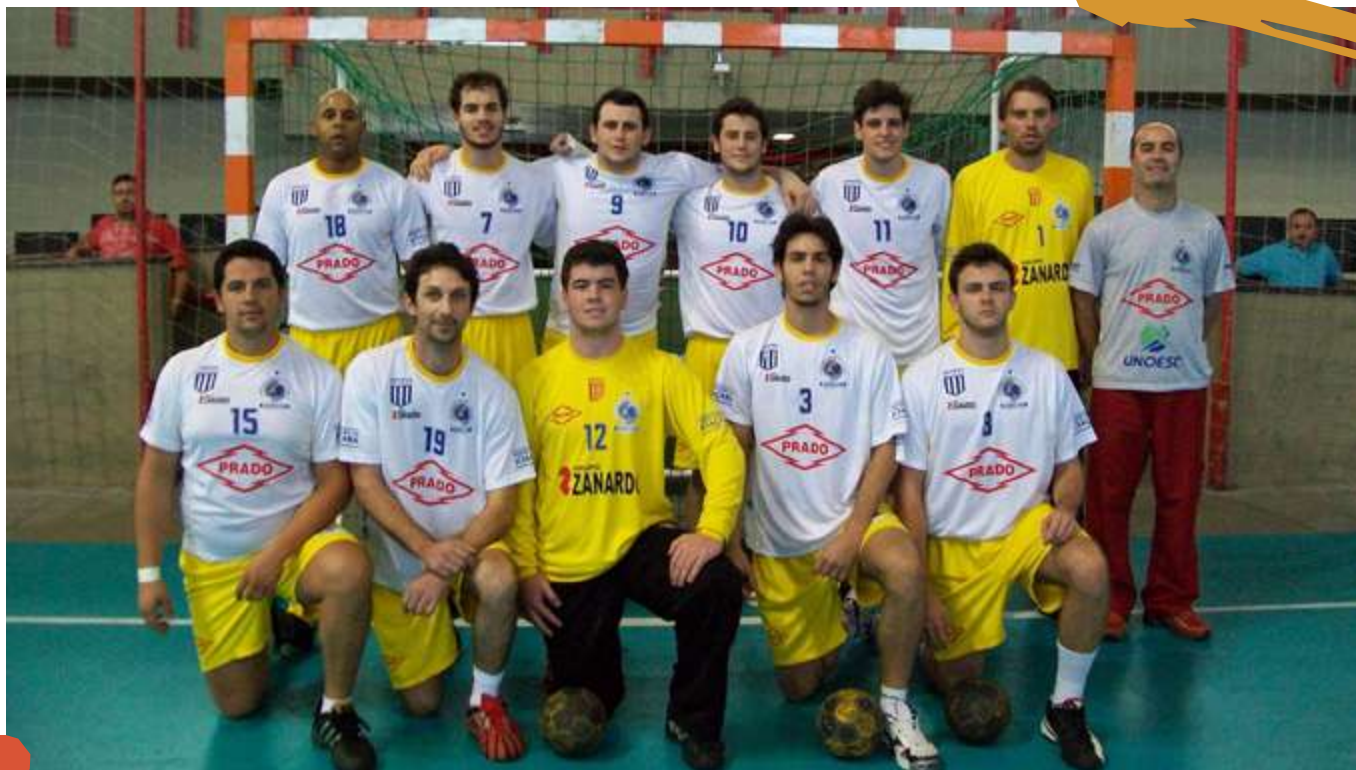
2009 – Equipe de handebol masculino. Jogos Universitários Brasileiros, Fortaleza, CE.