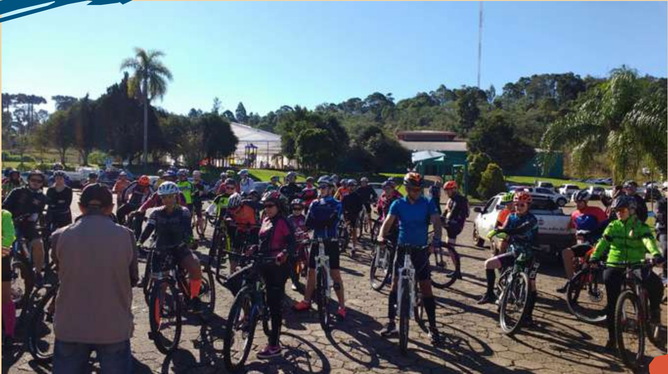
Passeio ciclístico Professor Raylander Righi – Trajeto de 24 km.