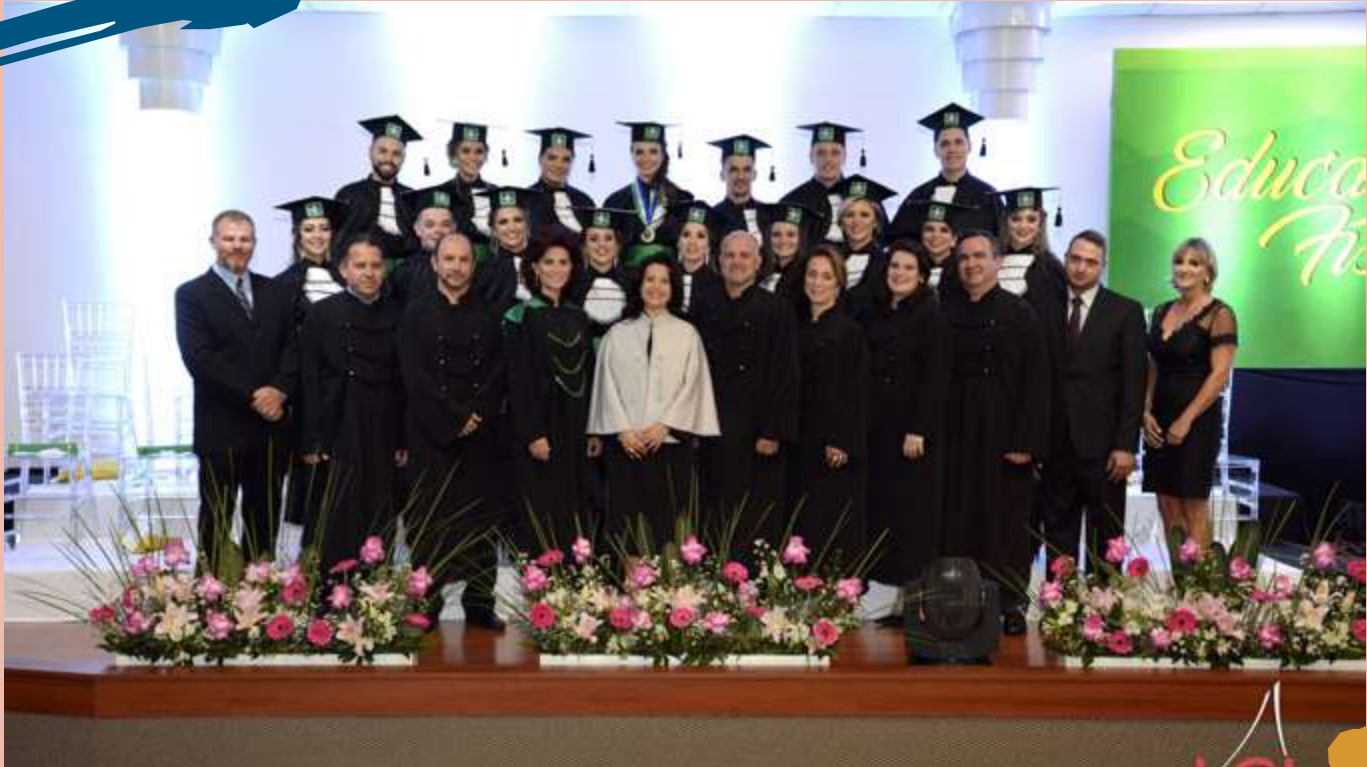
2018 – Turma de diplomados do Curso.