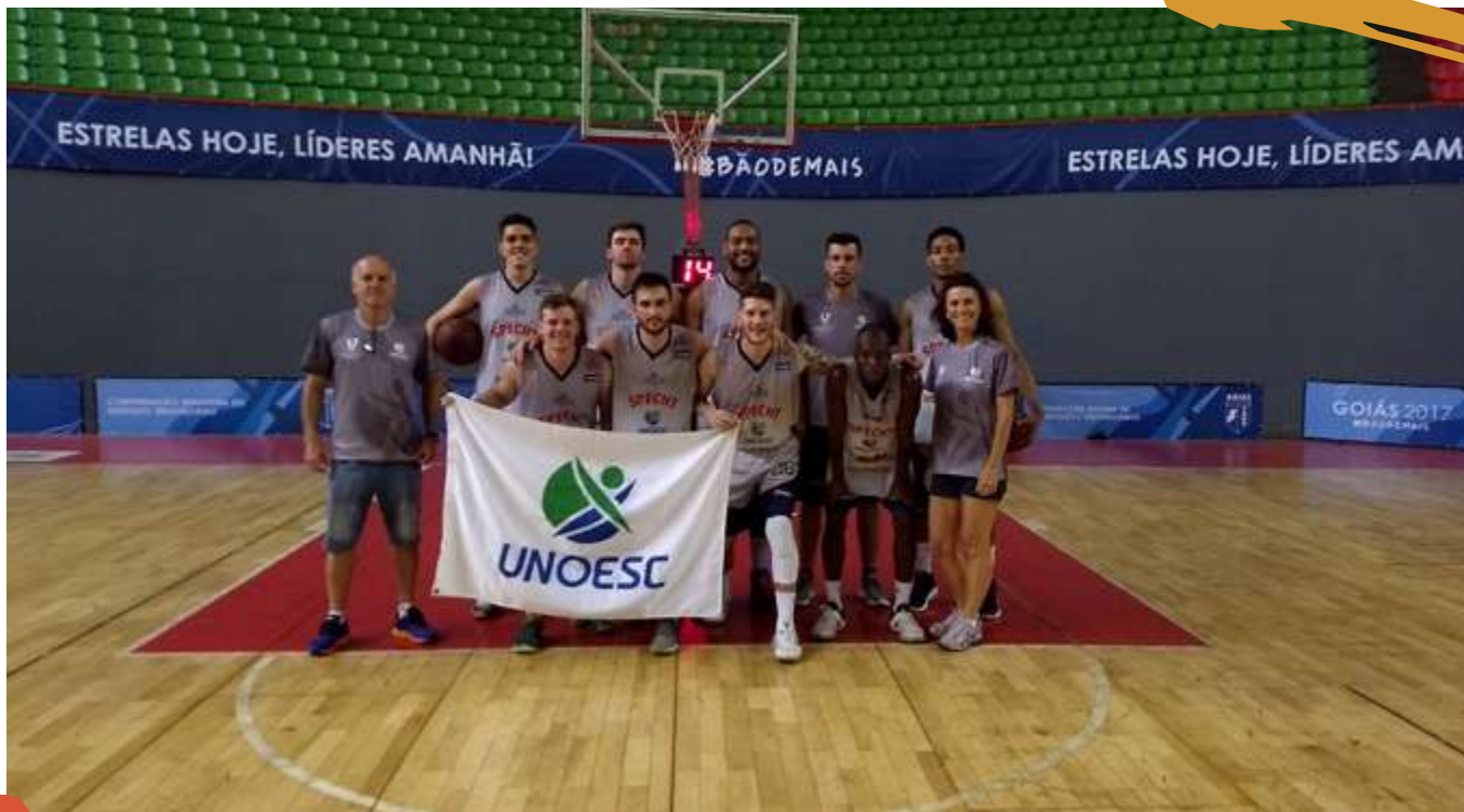
2017 – Equipe de basquetebol masculino. Jogos Universitários Brasileiros, Goiânia, GO.