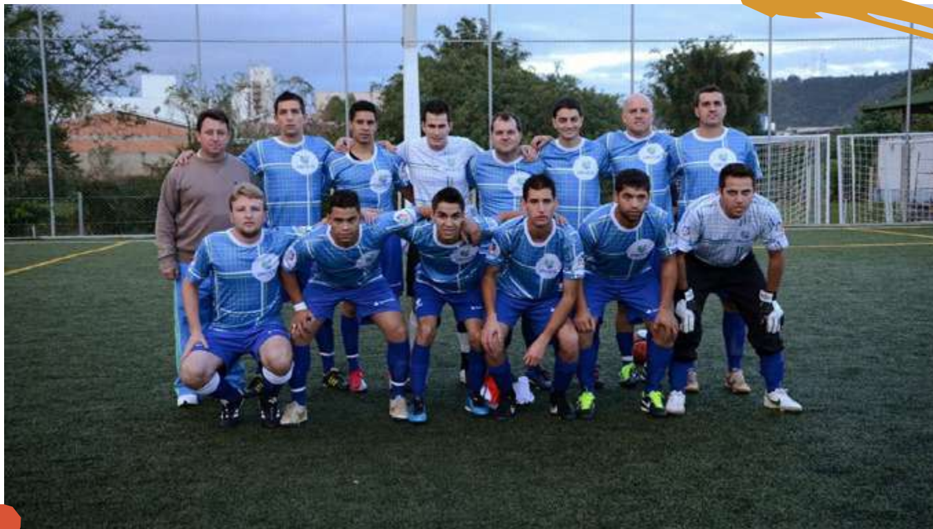
2014 – Equipe de suíço livre masculino. Cofafe, Itajaí, SC.