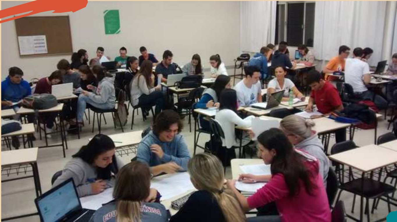
2017 – Ensino por meio de Metodologias Ativas Team Based Learning (TBL).