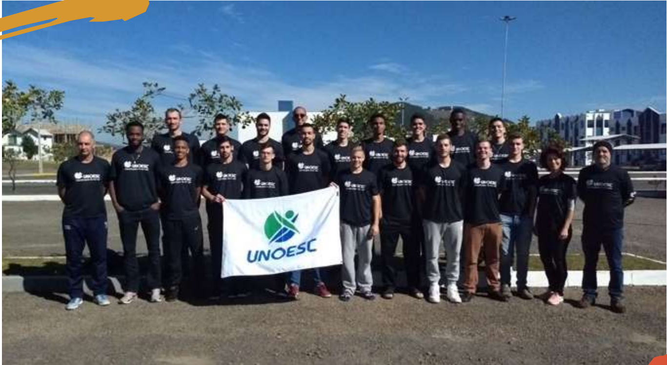
2018 – Equipes de voleibol e basquetebol masculino. Jogos Universitários Catarinenses, Lages, SC.