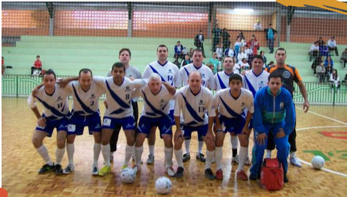
2010 – Equipe de futsal masculino. Cofafe, São Miguel do Oeste, SC.