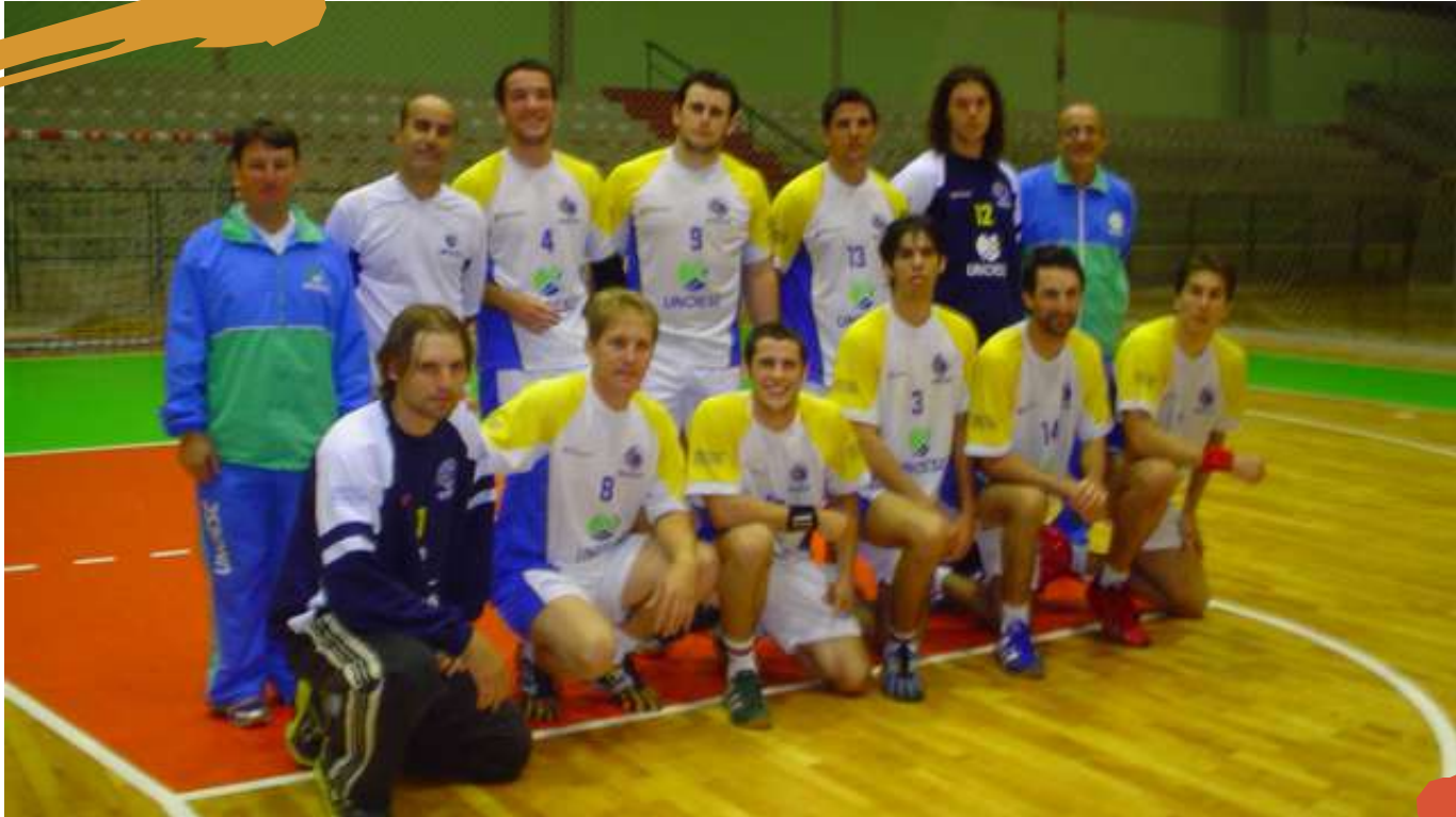
2007 – Equipe de handebol masculino nos Jogos Universitários Catarinenses. Blumenau, SC.