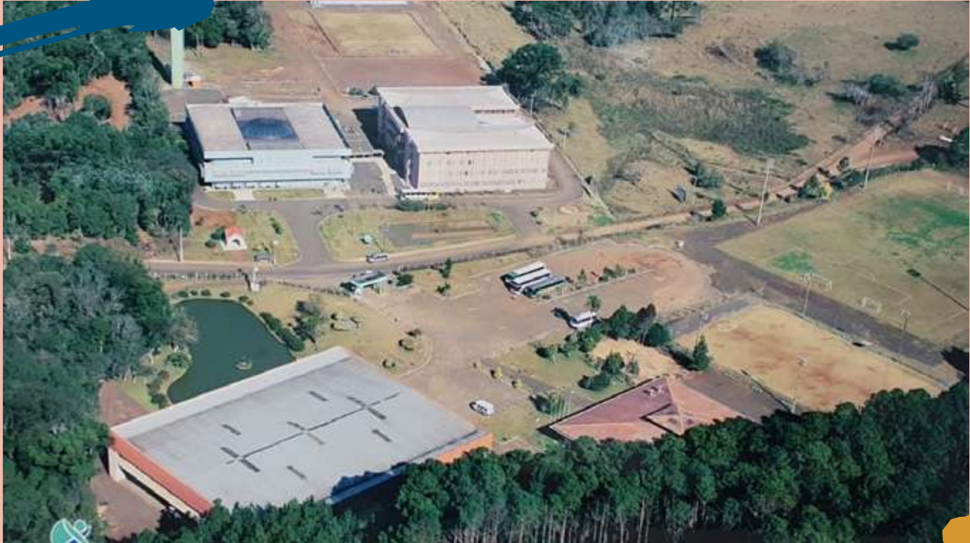
2007 – A Unoesc adquiriu o Complexo Esportivo do SESI.