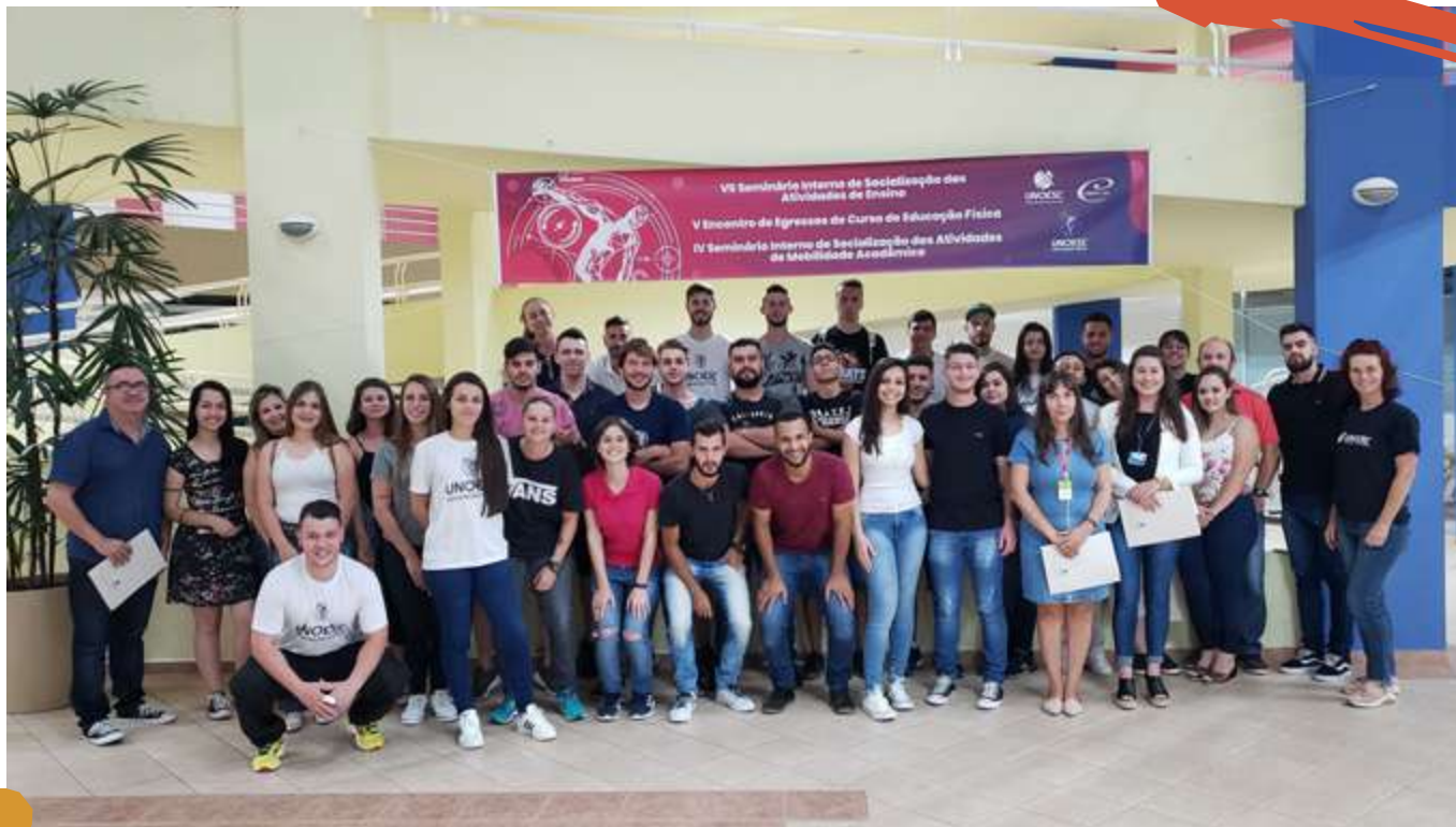
2019/2 – 7º Seminário Interno de Socialização das Atividades de Ensino.