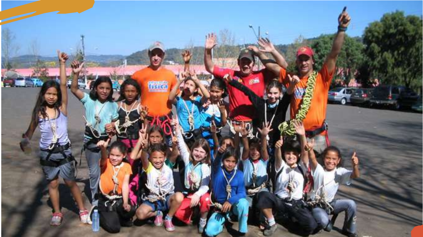
2009 – Projeto de extensão Saúde 10. Joaçaba, SC.