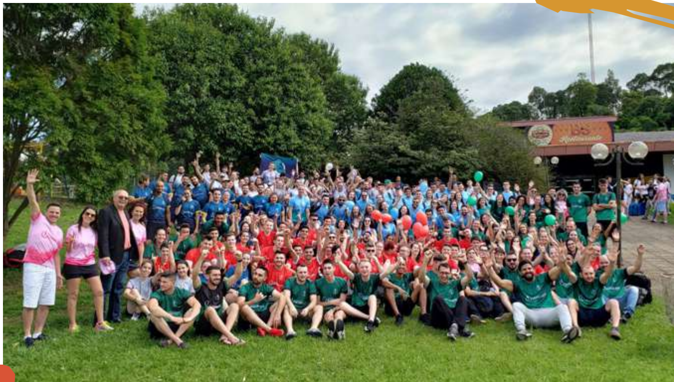
2019 – 2º Jogos Intercampi, Joaçaba, SC.