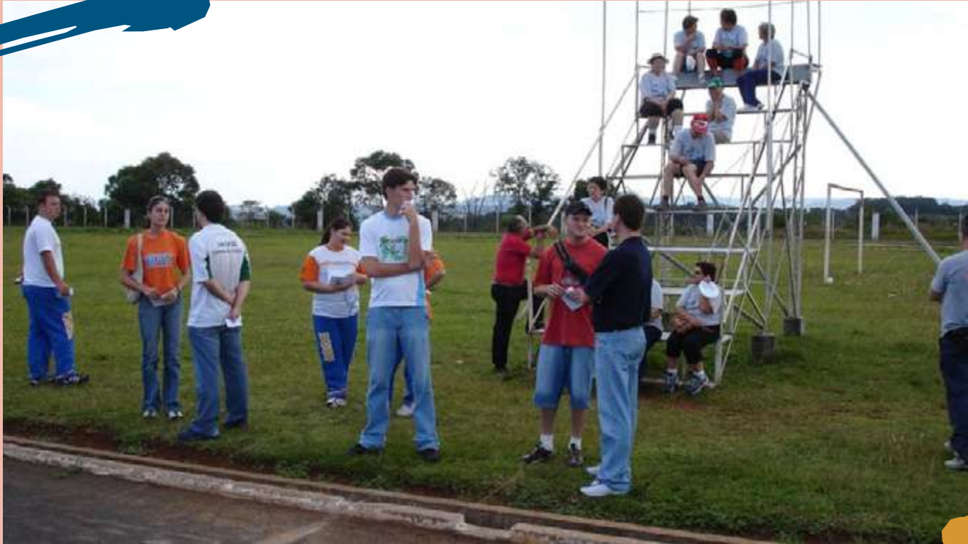
2002 – Atividade de extensão na Pista de Atletismo do Clube Comercial com indivíduos idosos na avaliação e aplicação de bateria de testes.