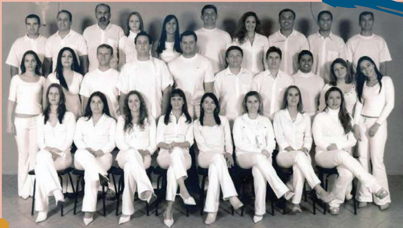
2006 – 2ª Turma de diplomados do Curso.