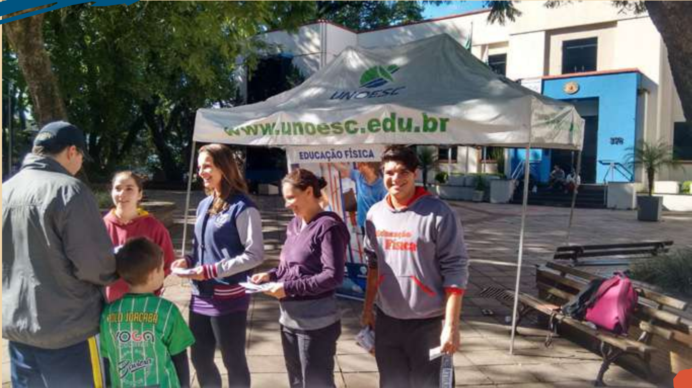
2016 – A importância da atividade física para a saúde – Praça de Joaçaba.