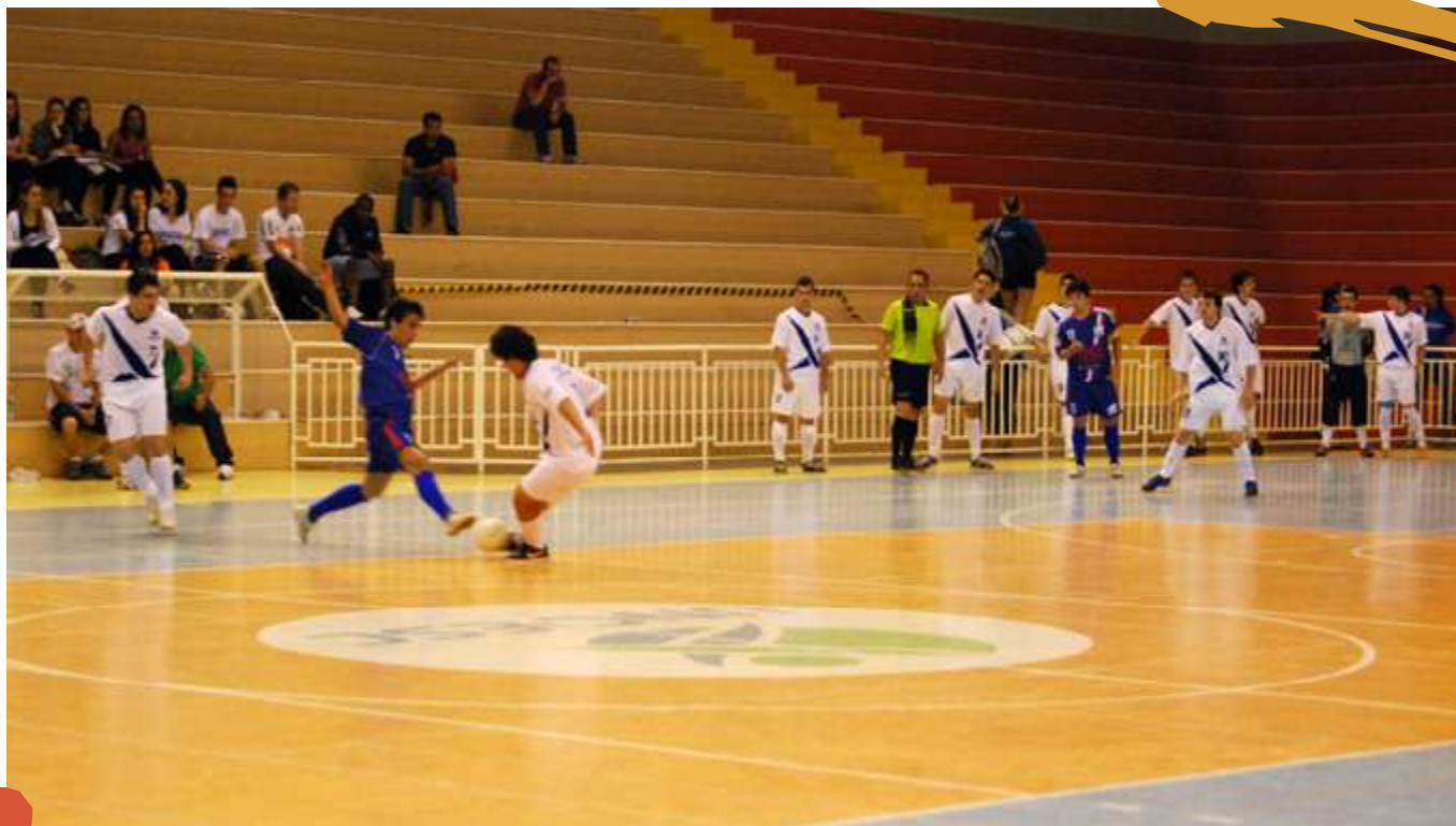
2012 – Jogo de futsal masculino. Jogos Universitários Catarinenses. Joaçaba, SC.