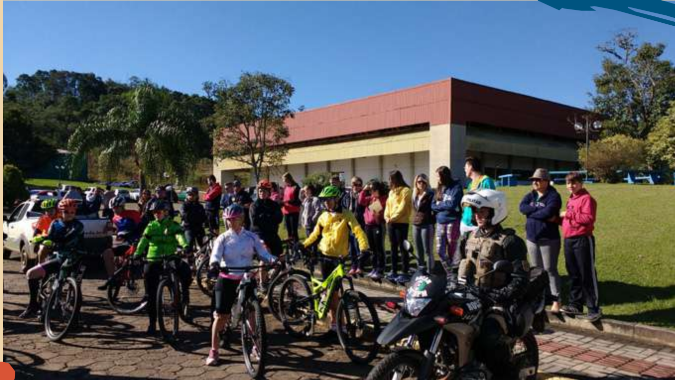
Passeio ciclístico Professor Raylander Righi – Trajeto de 24 km.