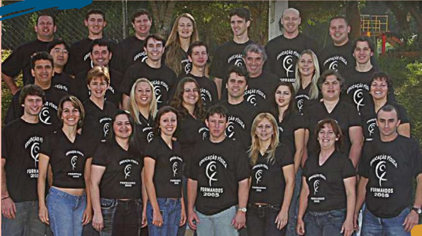
2005 – 1ª Turma de diplomados do Curso.