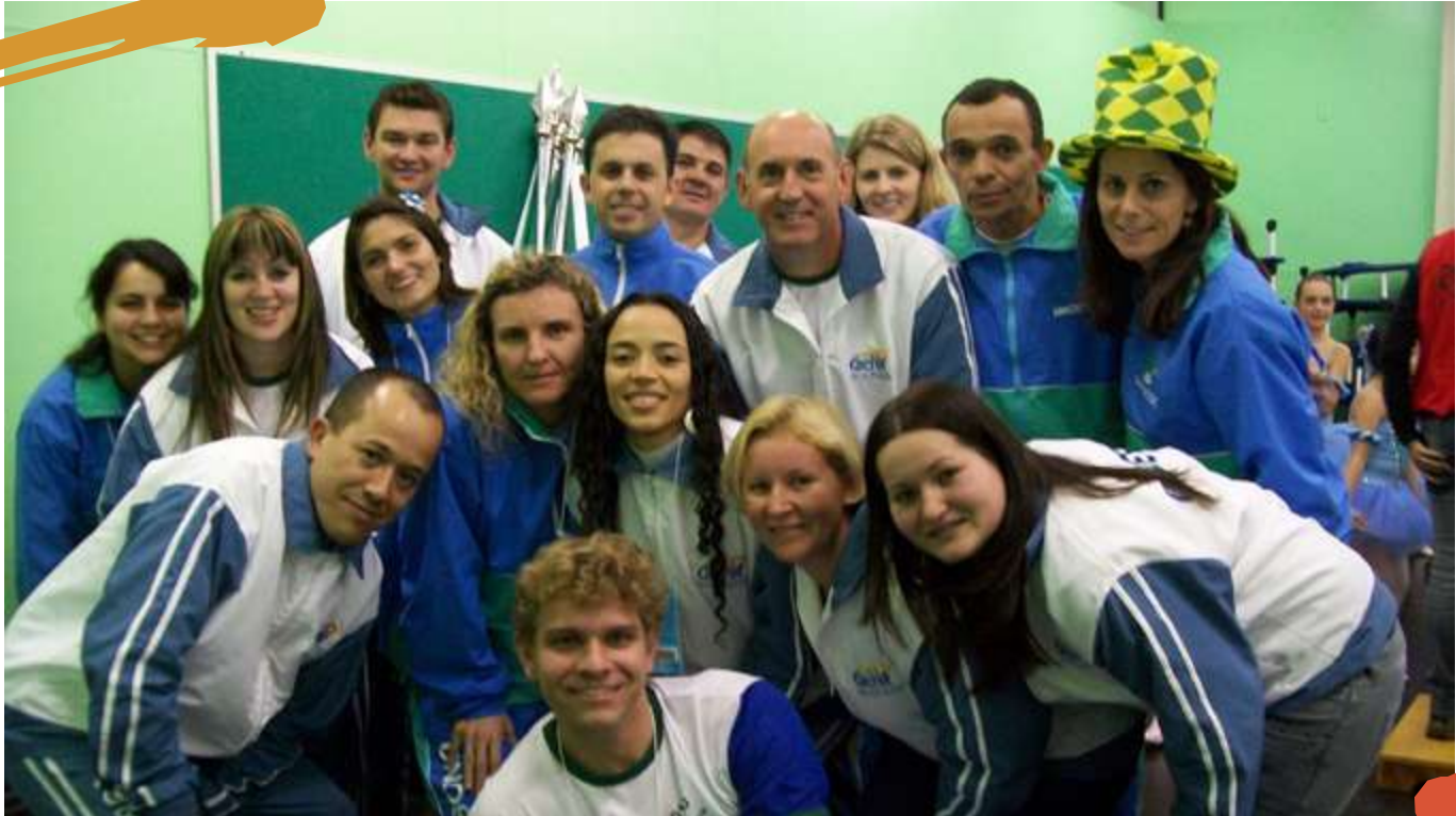
2010 – Preparação para o Cerimonial de Abertura. Cofafe, São Miguel do Oeste, SC.