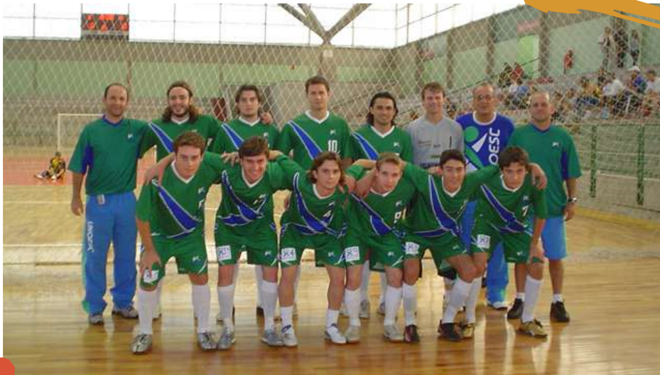
2007 – Equipe de futsal masculino nos Jogos Universitários Catarinenses. Blumenau, SC.