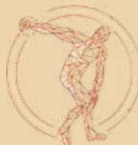
Unoesc Abraça – Evento esportivo social e cultural para adolescentes.