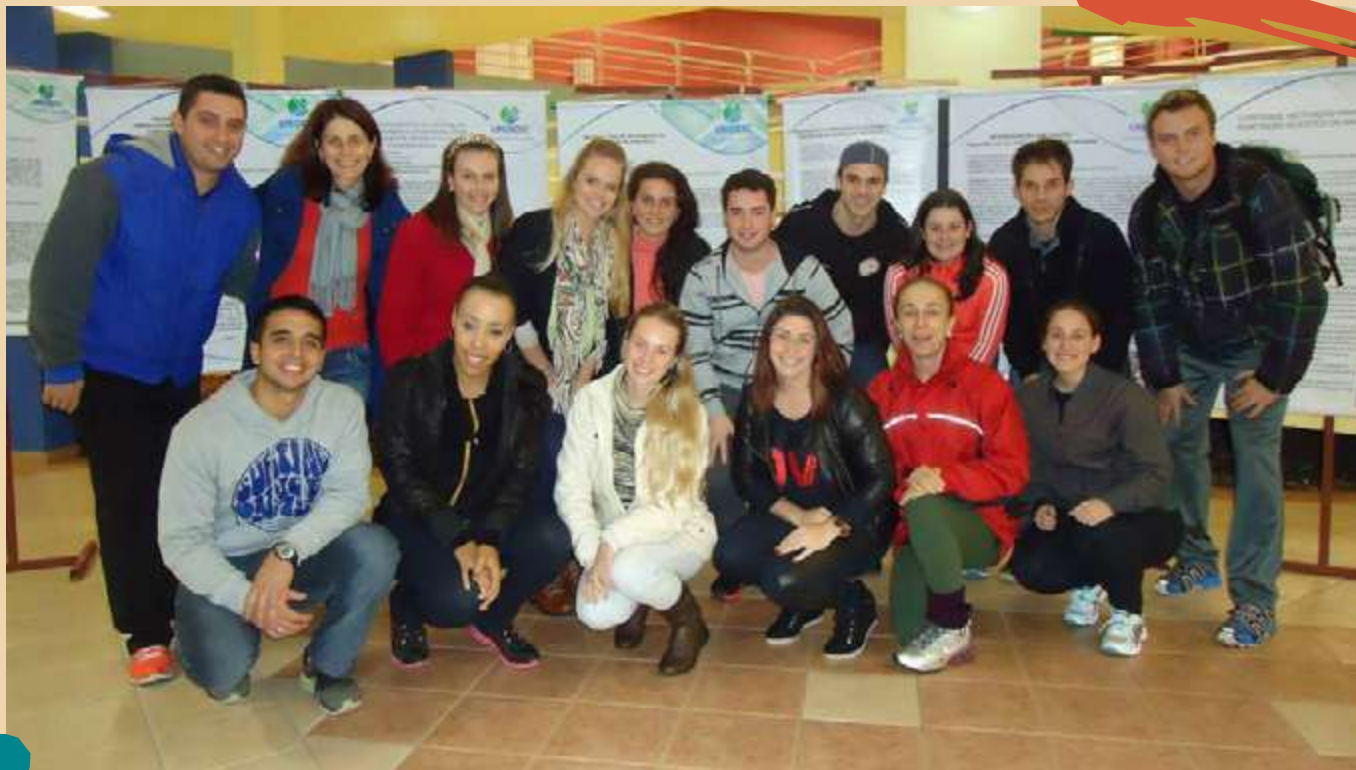
2014 – Apresentação de trabalhos - Seminário dos Estágios.