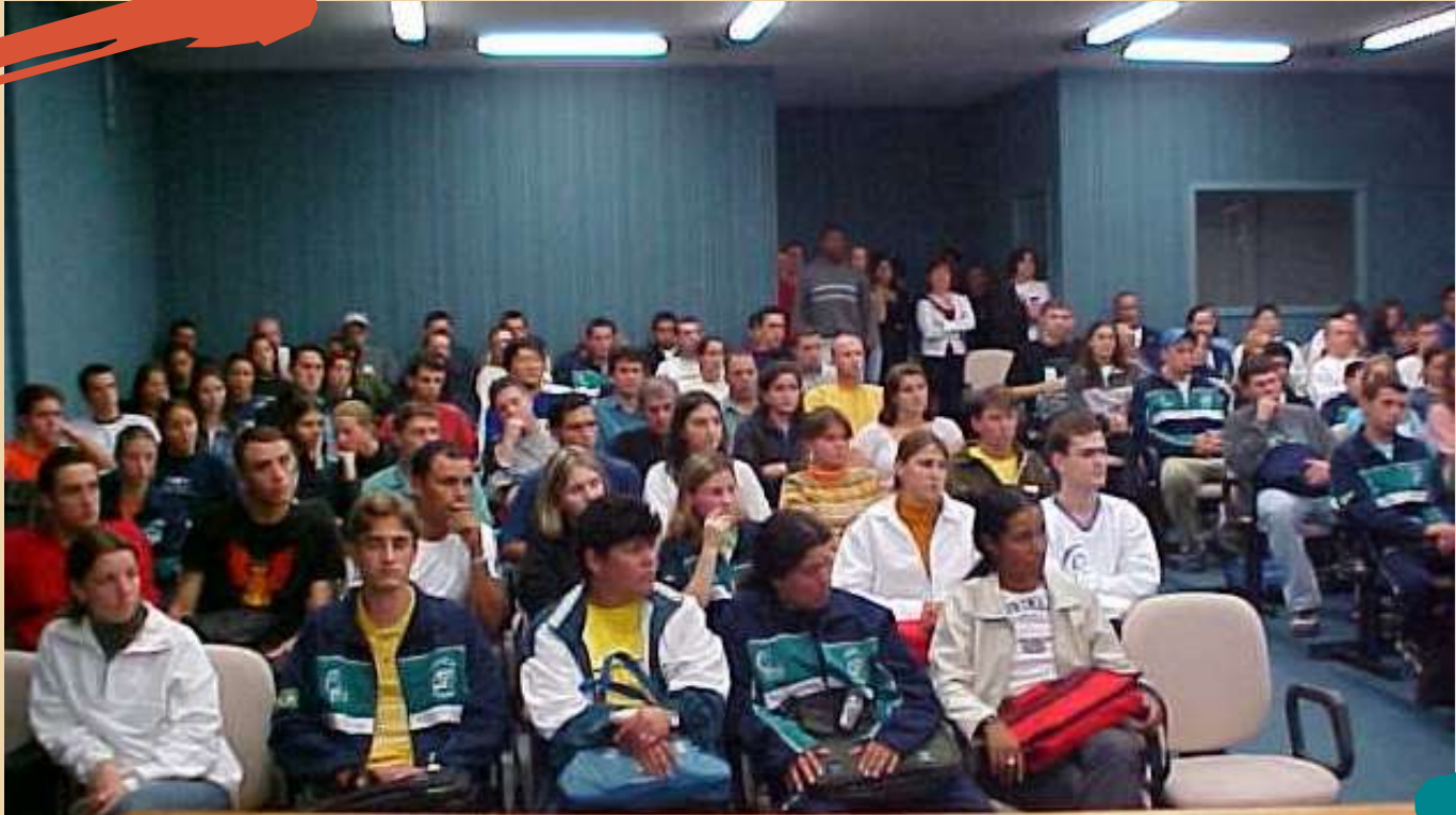
2003 – Início das aulas do Curso de Educação Física, Unoesc, Campus Joaçaba. Acolhida no Auditório.