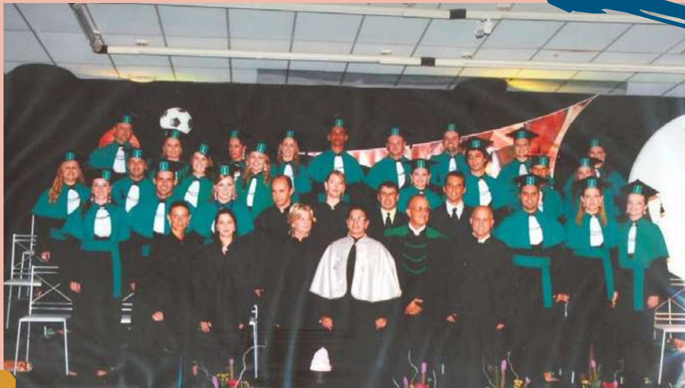
2009 – Turma de diplomados do Curso, 1º semestre.