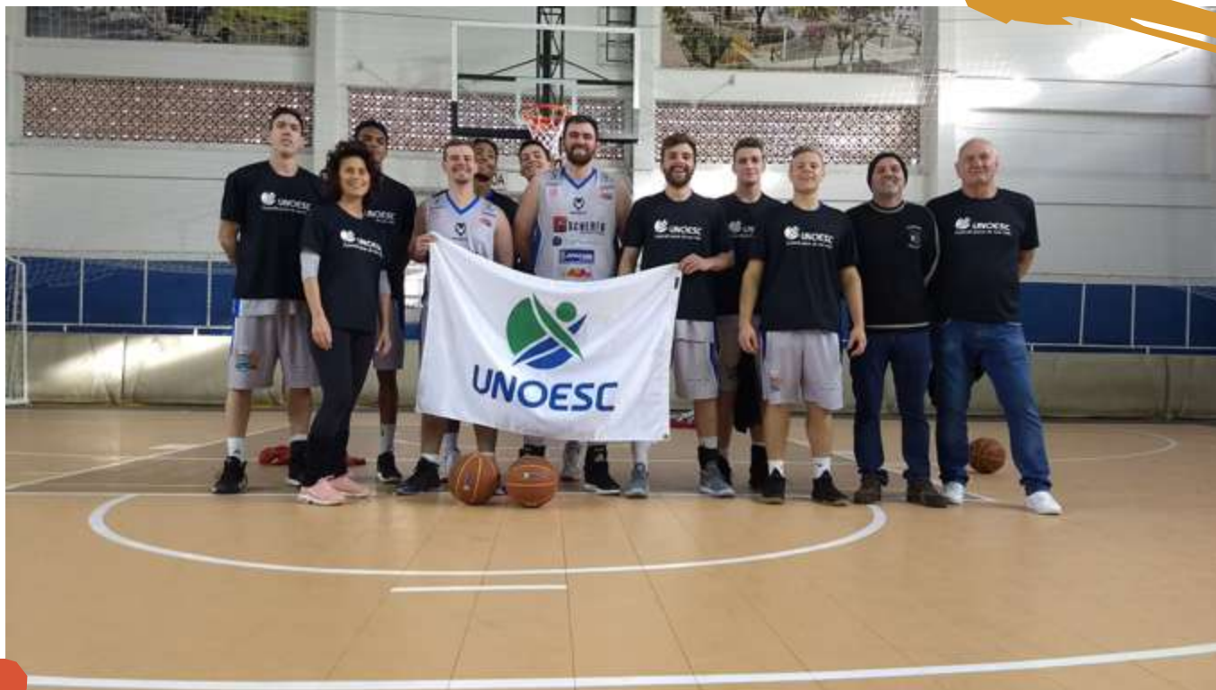
2018 – Equipe de basquetebol masculino. Jogos Universitários Catarinenses, Lages, SC.