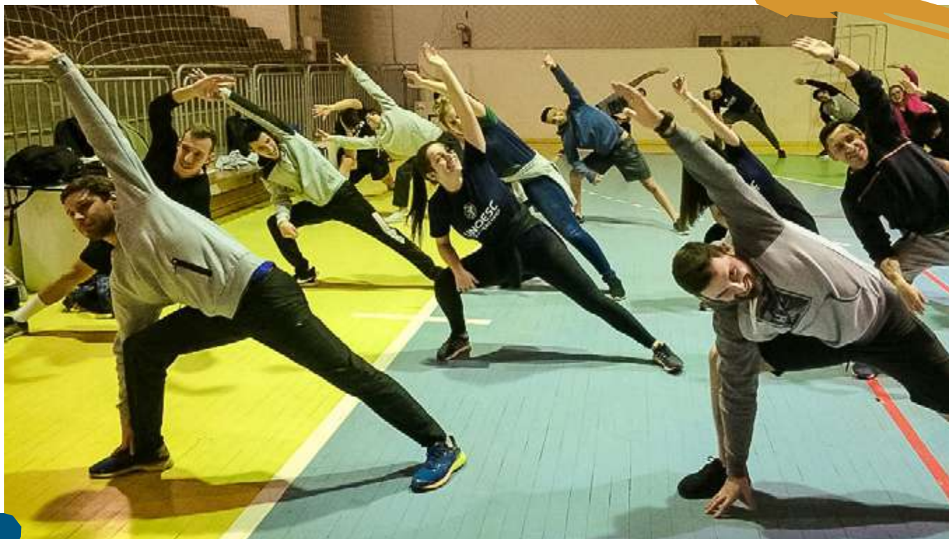
2019 – Corporeidade.