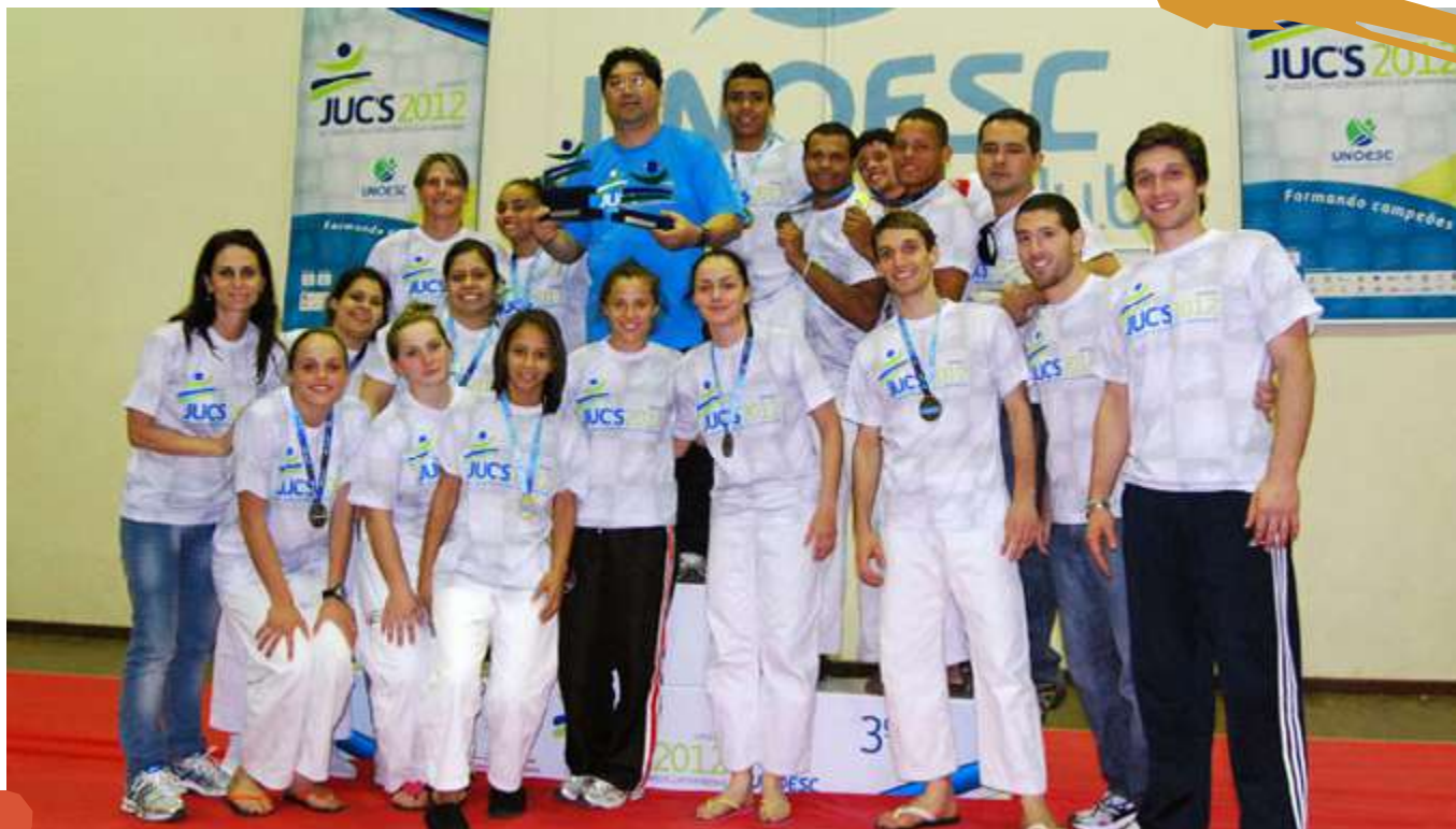
2012 – Premiação das equipes de judô masculino e feminino. Jogos Universitários Catarinenses. Joaçaba, SC.