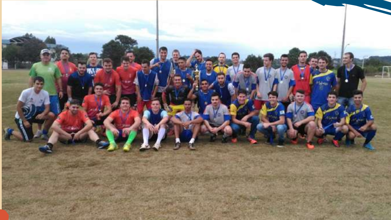
Unoesc Esporte - Atividade Esportiva para alunos da Unoesc.