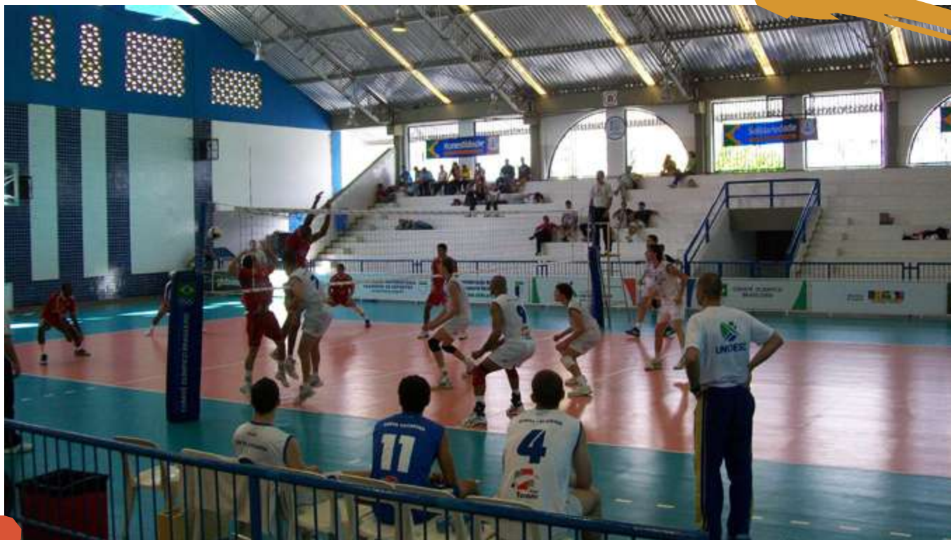
2009 – Equipe de voleibol masculino. Jogos Universitários Brasileiros, Fortaleza, CE.