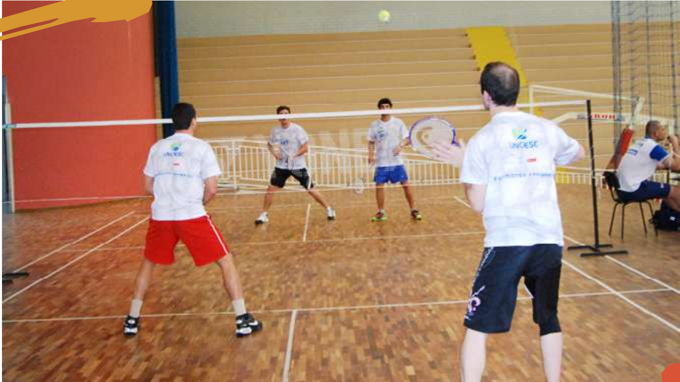
2012 – Partida de badminton masculino. Jogos Universitários Catarinenses. Joaçaba, SC.