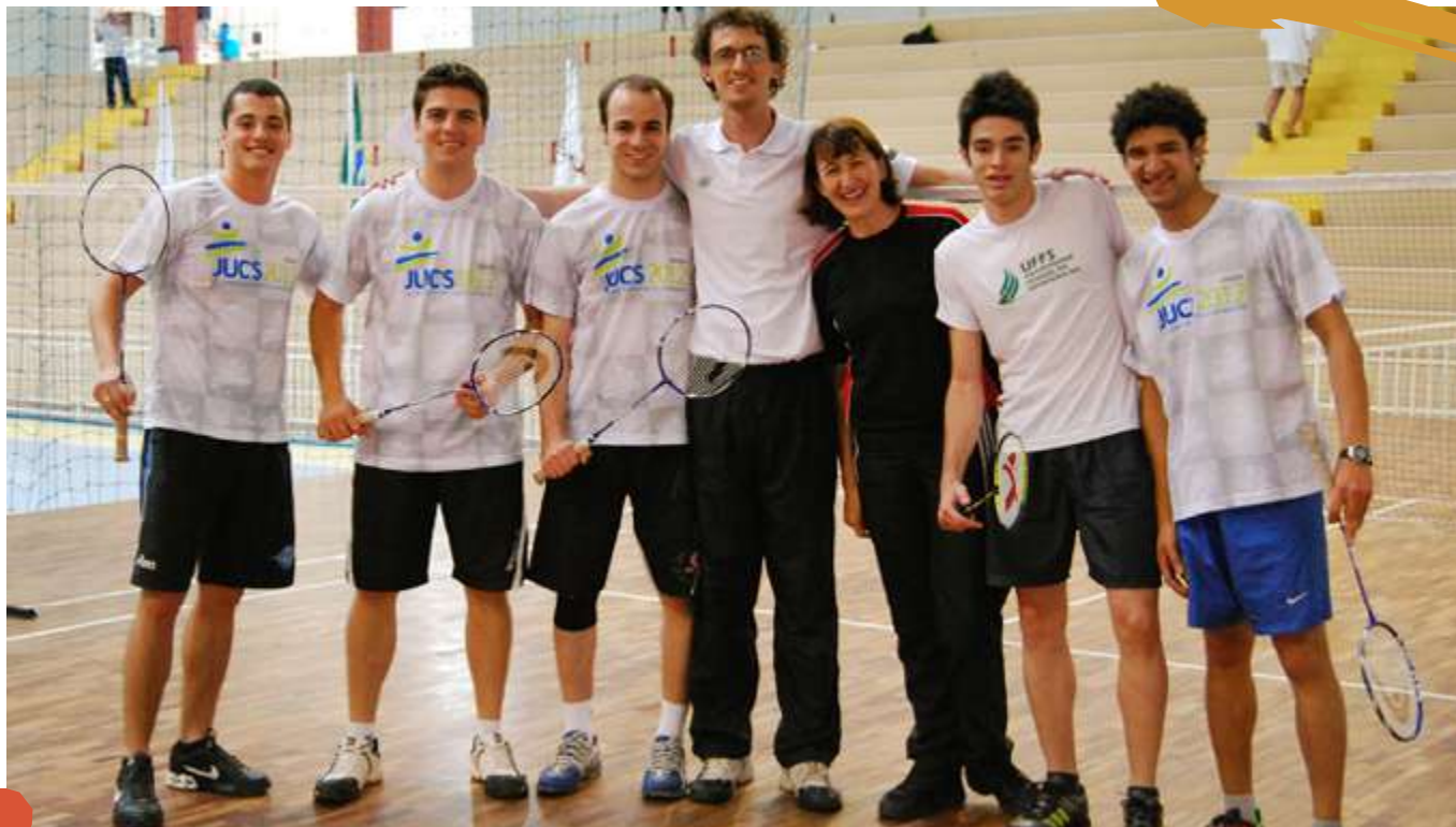
2012 – Equipe de badminton. Jogos Universitários Catarinenses. Joaçaba, SC.