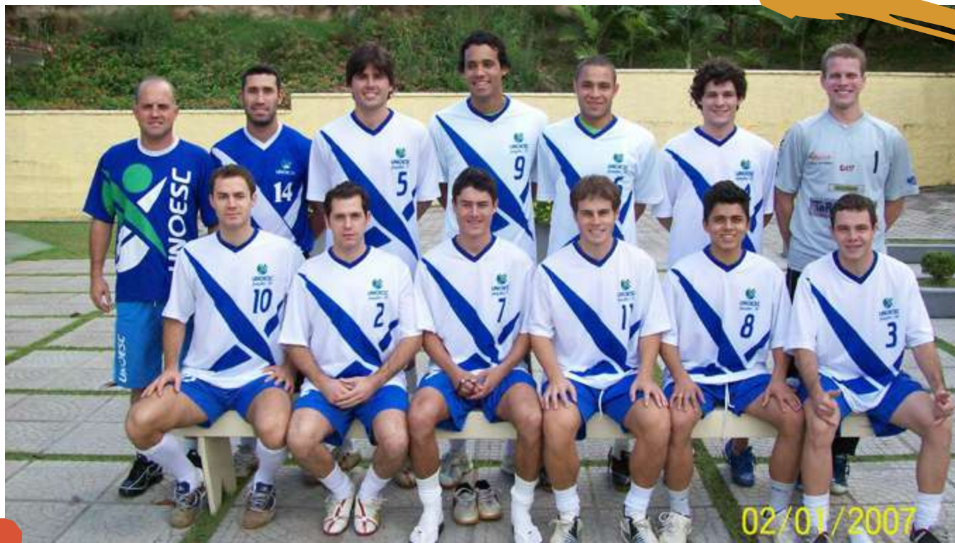
2008 – Equipe de futsal masculino. Jogos Universitários Catarinenses, Jaraguá do Sul, SC.