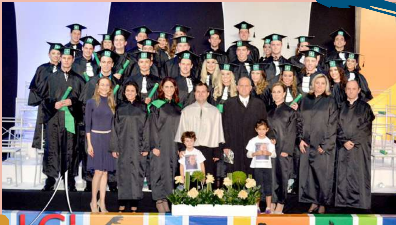
2014 – Turma de diplomados do Curso.