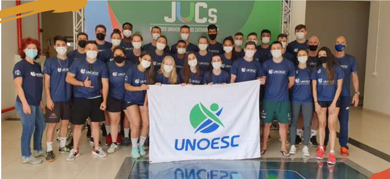
2021 – Delegação da Unoesc, 1ª etapa. Jogos Universitários Catarinenses, Lages, SC.