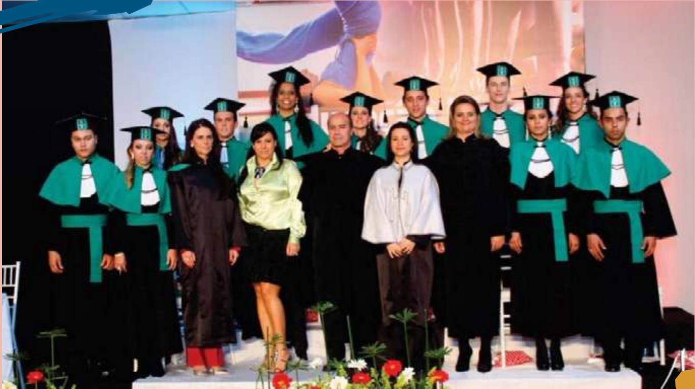
2012 – Turma de diplomados do Curso.