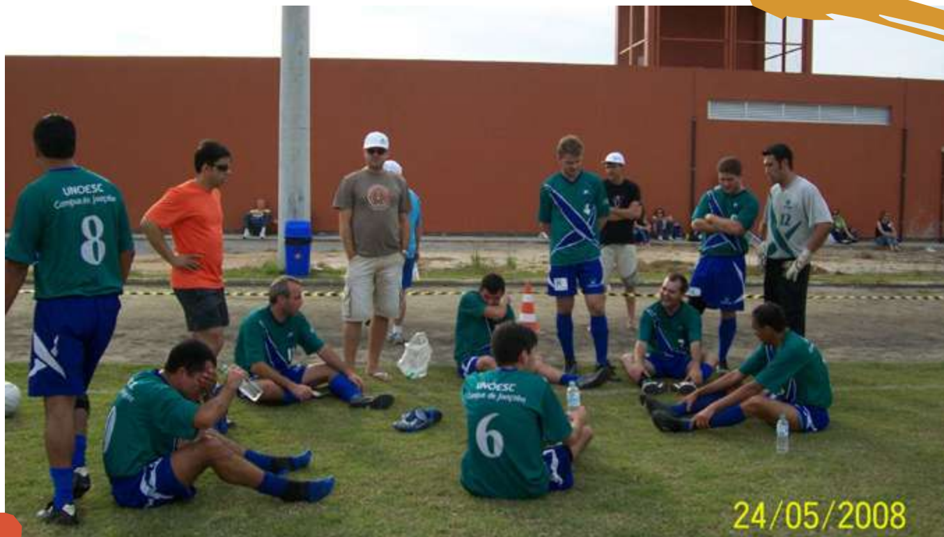
2008 – Momento após o jogo da equipe de suíço masculino livre. Cofafe, Unisul Pedra Branca, Palhoça, SC.