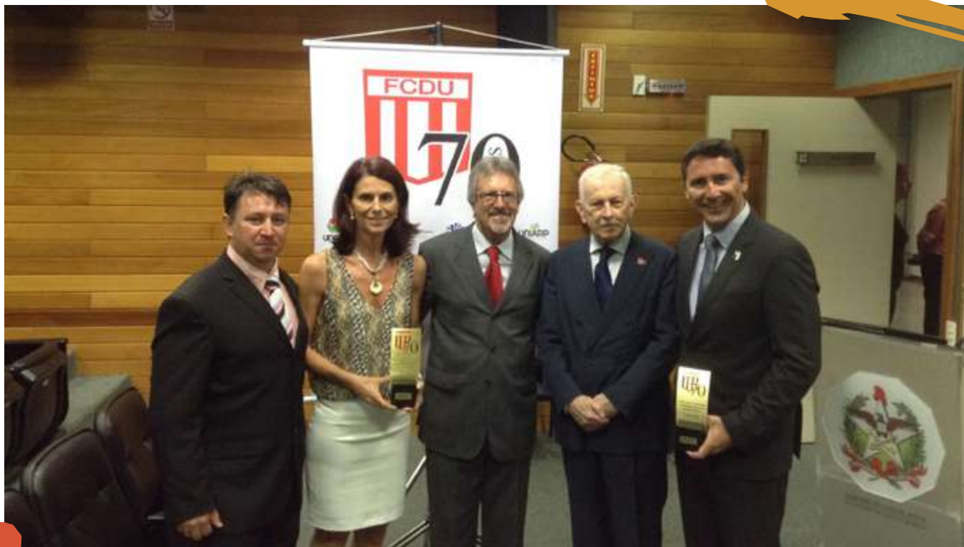
2014 – Solenidade de 70 anos da Federação do Desporto Universitário (FCDU). Florianópolis, SC.