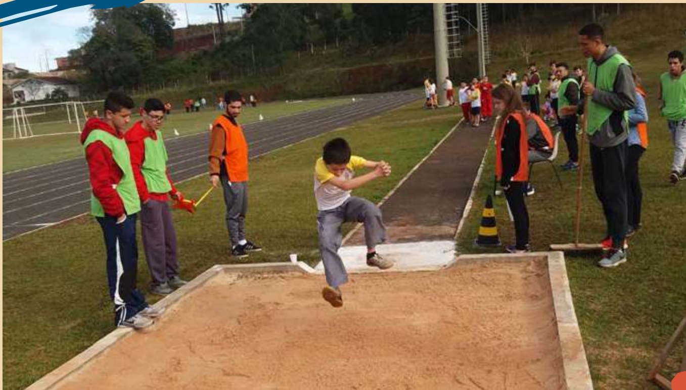
2018 – Festival de Atletismo – Pista Atlética campus II.