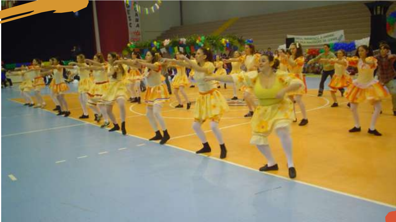
2004 – Cerimonial de Abertura da Cofafe, com apresentação das acadêmicas do Curso de Educação Física. Joaçaba, SC.