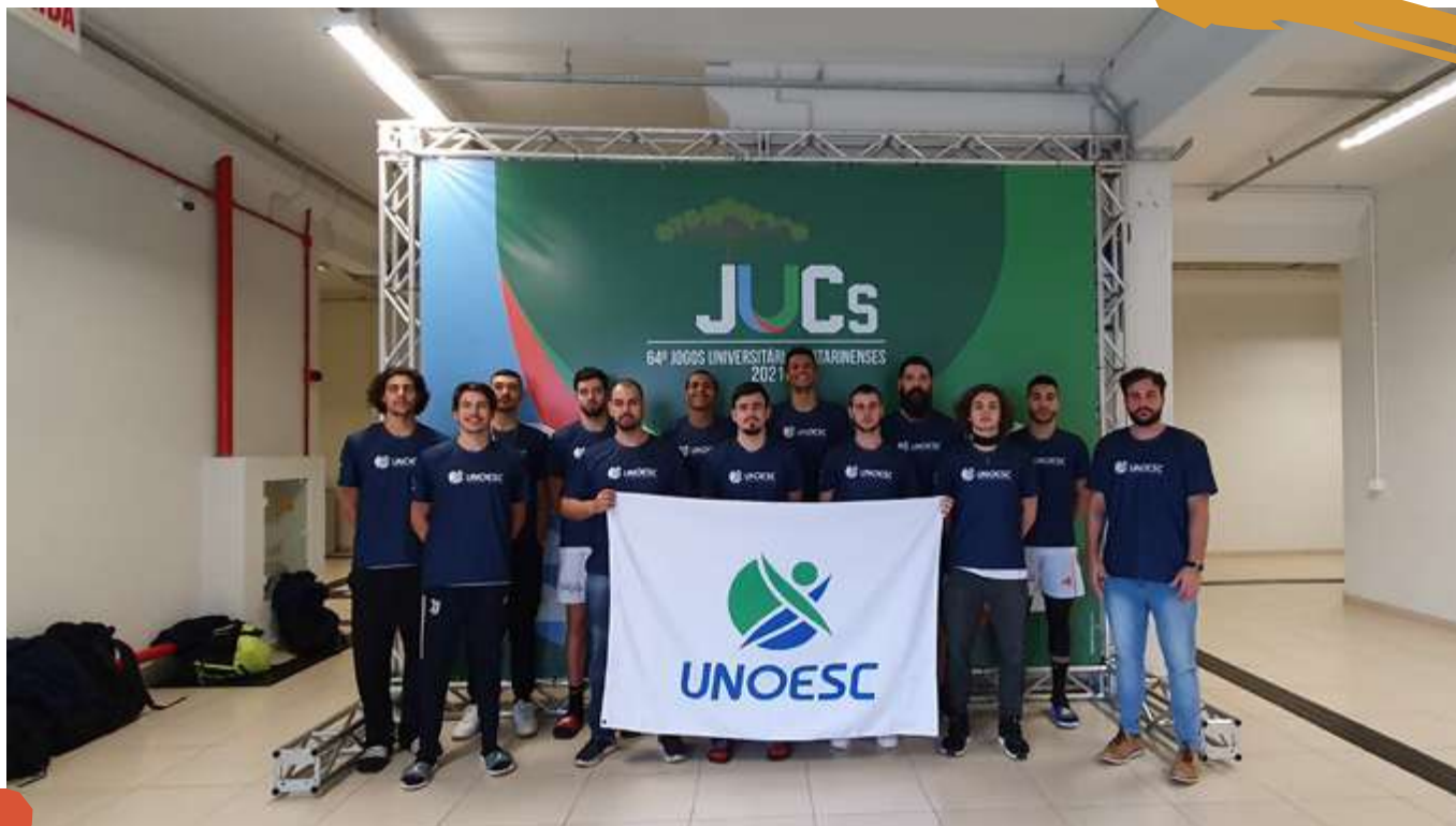
2021 – Delegação da Unoesc, 2ª etapa. Jogos Universitários Catarinenses, Lages, SC.