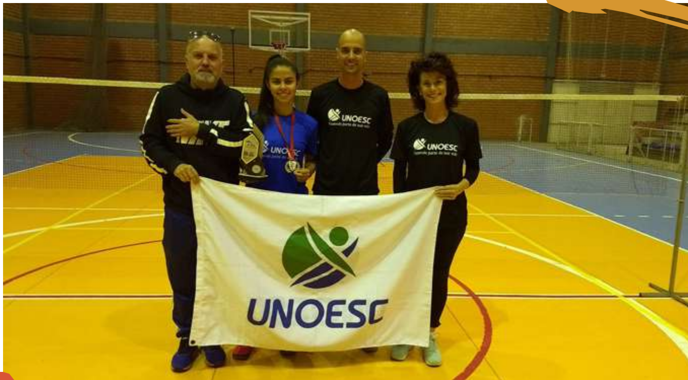
2018 – Badminton feminino. Jogos Universitários Catarinenses, Lages, SC.