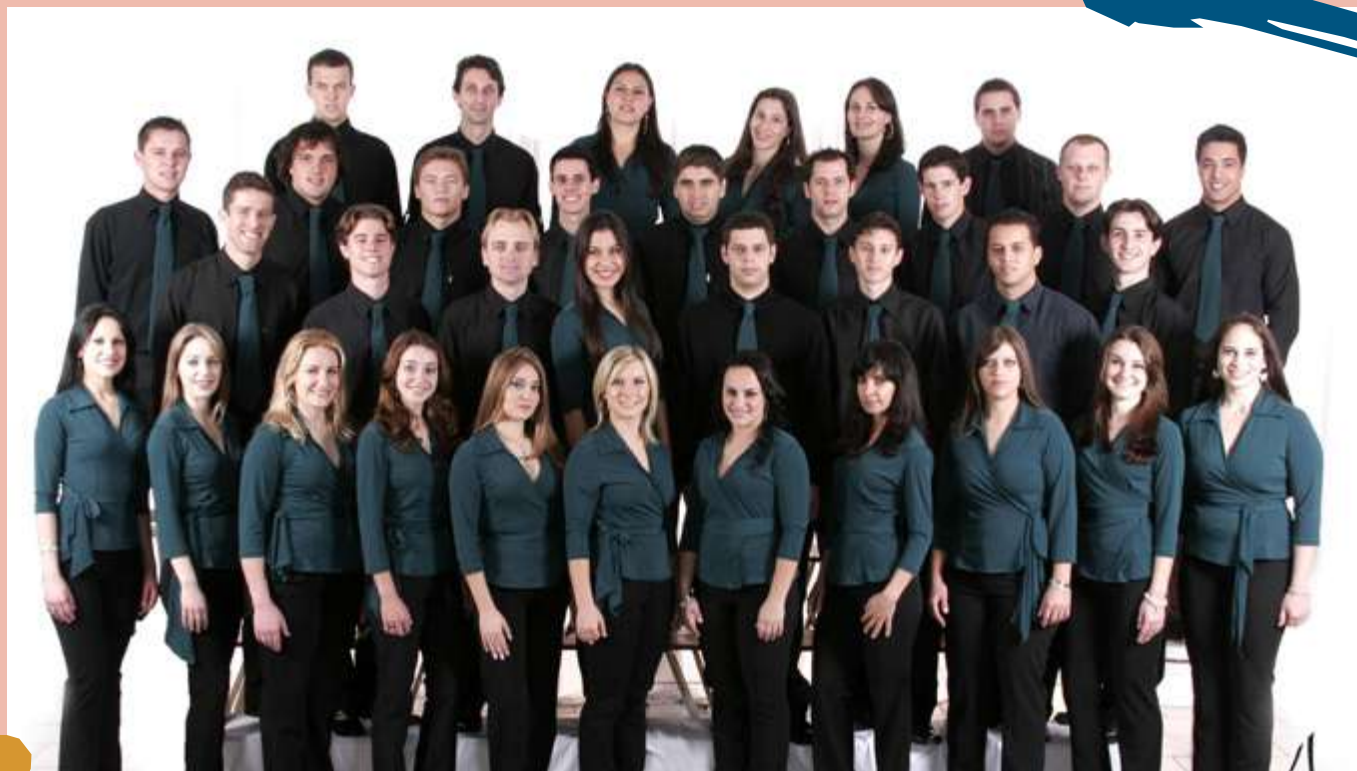
2010 – Turma de diplomados do Curso.