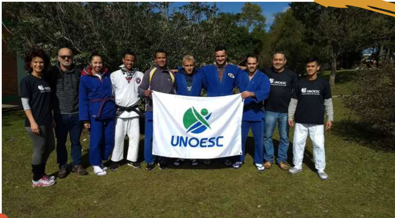
2018 – Equipe de Judô. Jogos Universitários Catarinenses, Lages, SC.