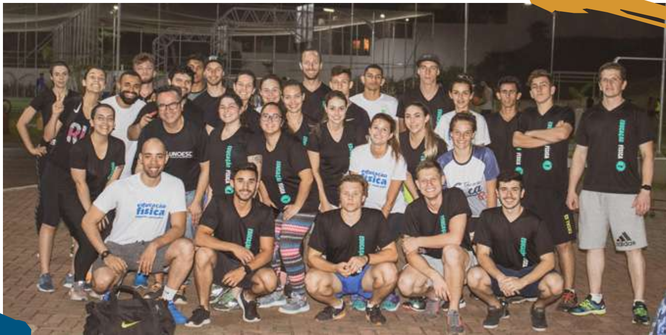
2018 – Educação Física e Saúde Pública.