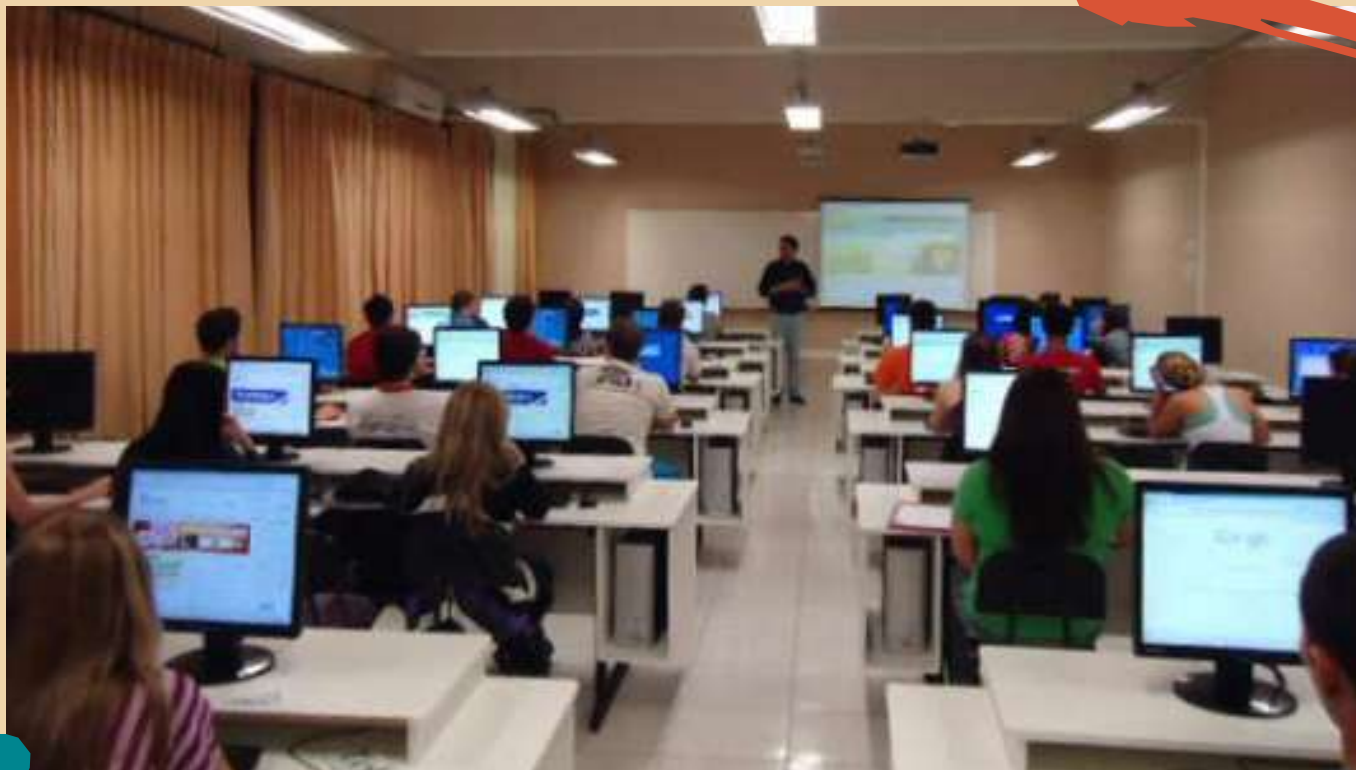
2010 – Aula de Metodologia Científica no laboratório de informática.