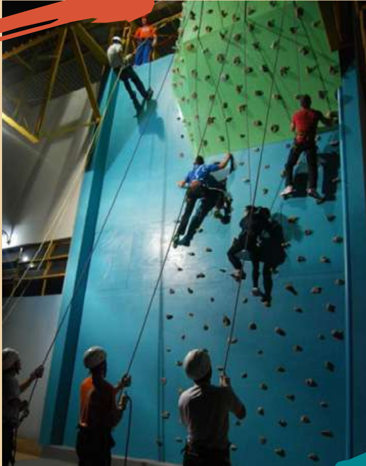
2013 – Aula de Esportes de Aventura no paredão de escalada instalado no Complexo Esportivo da Unoesc.