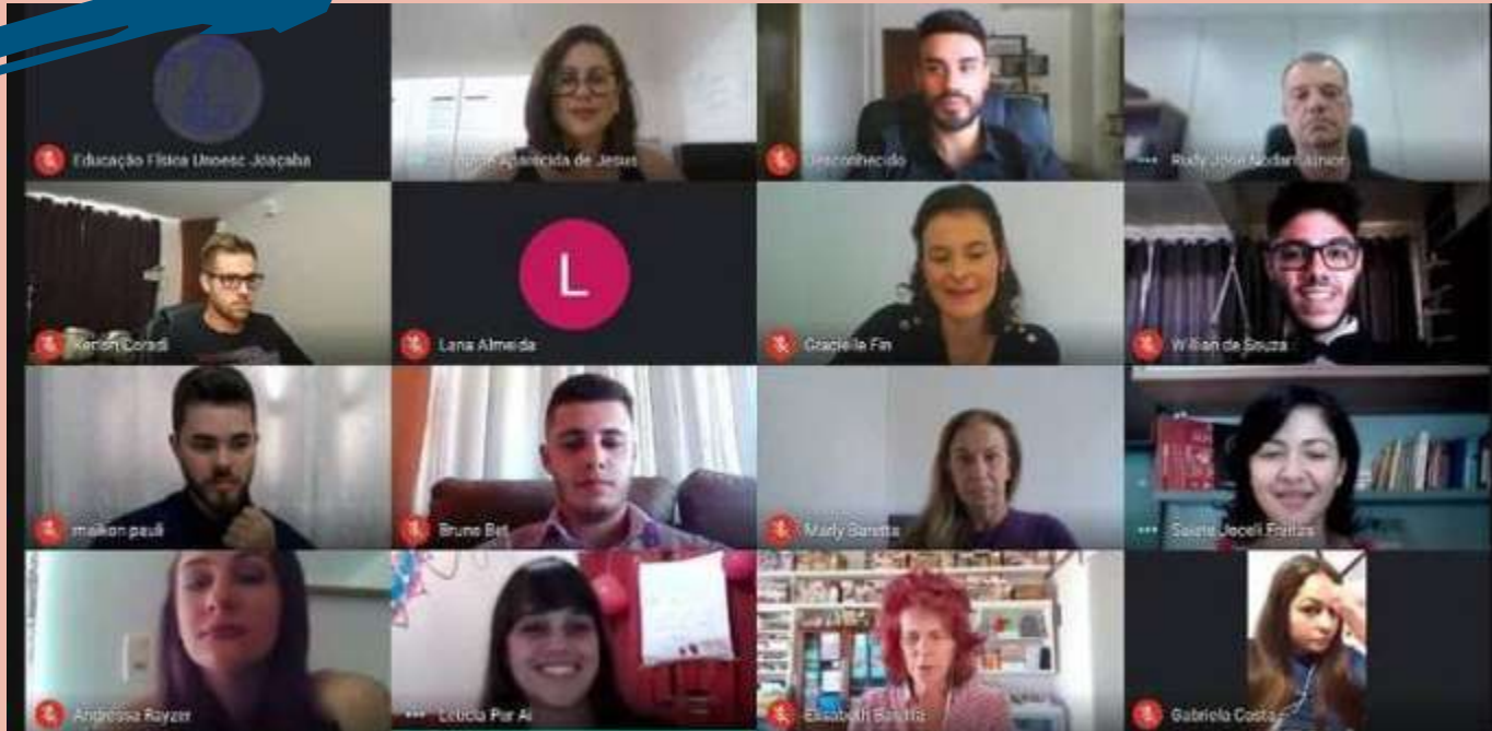
2021 – Turma de diplomados do Curso.