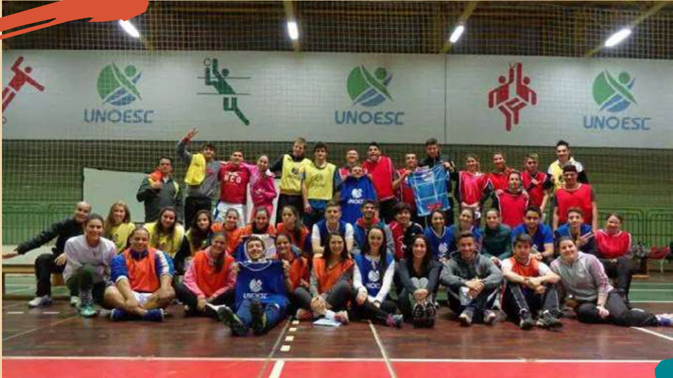
2014 – Atividade teórico-prática preparação para o Enade.