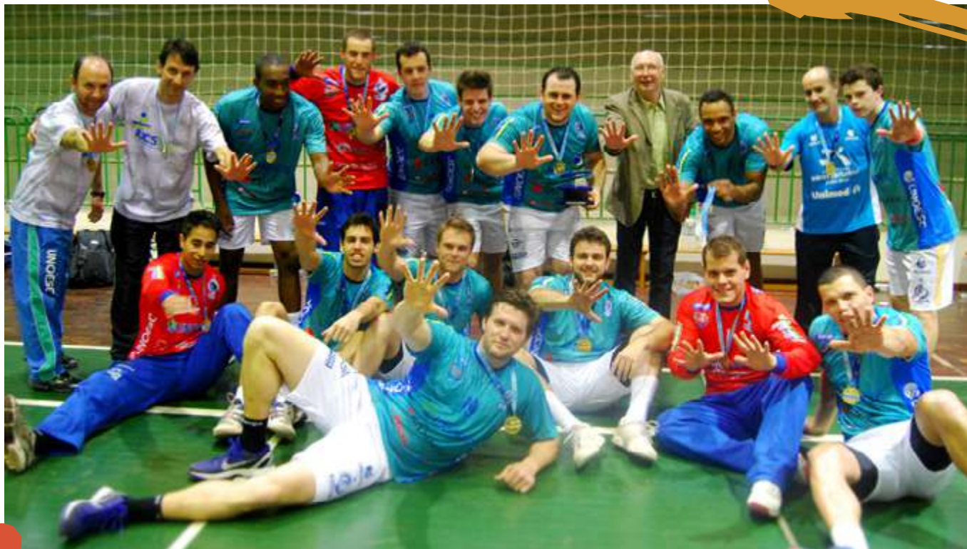
2012 – Equipe de handebol masculino, campeã dos Jogos Universitários Catarinenses (JUCs). Joaçaba, SC.