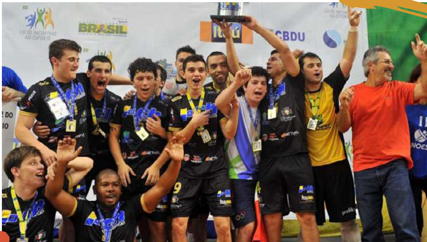
2013 – Equipe de futsal masculino. Liga de Desporto Universitário. Volta Redonda, RJ.