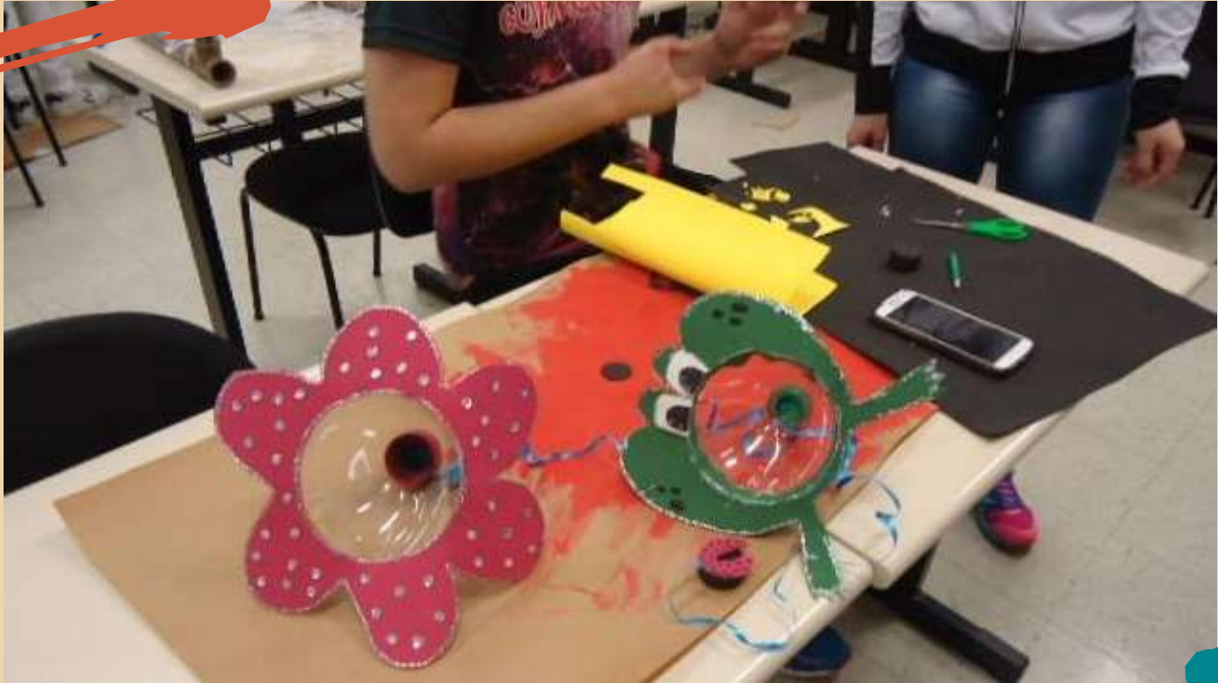
2016 – Aula de confecção de brinquedos com materiais reciclados.