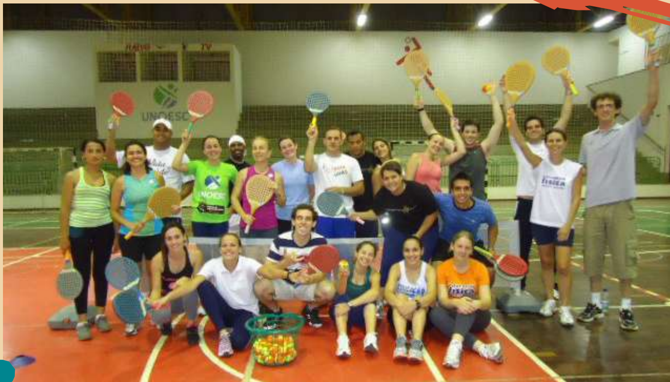
2012 – Atividades multidisciplinares.