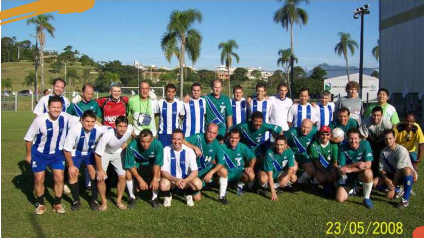
2008 – Confraternização das equipes de suíço masculino sênior. Cofafe, Unisul Pedra Branca, Palhoça, SC.