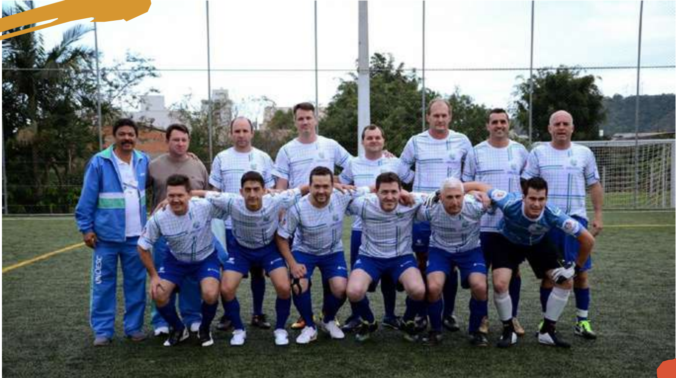
2014 – Equipe de suíço sênior masculino. Cofafe, Itajaí, SC.