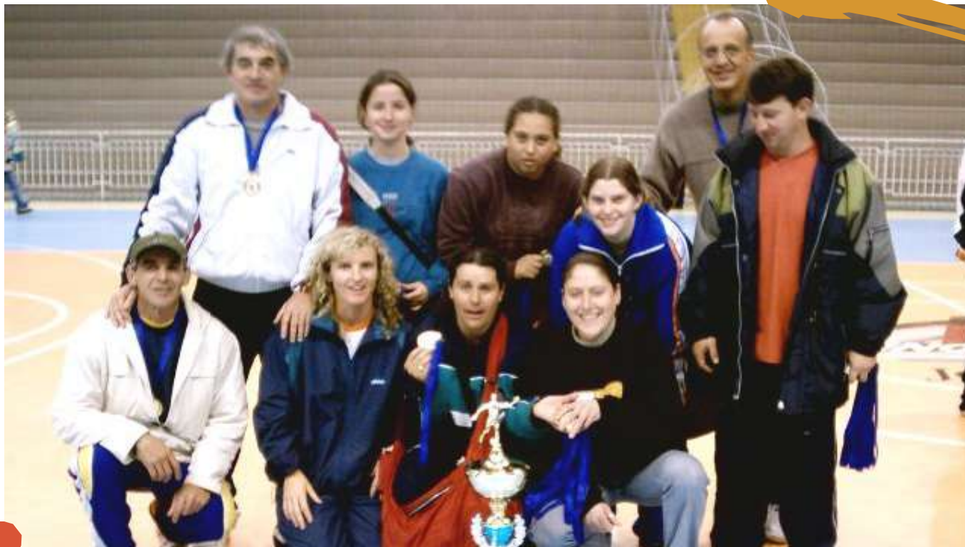
2005 – Seletivas das modalidades individuais para a retomada dos Jogos Universitários Catarinenses – modalidade de futsal. Joaçaba, SC.