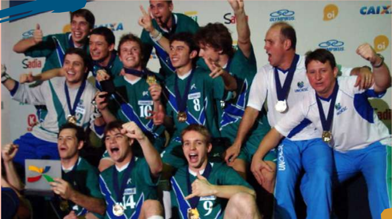
2006 – A equipe de Futsal Masculino da Unoesc sagrou-se campeã nacional nos Jogos Universitários Brasileiros, Brasília, DF.