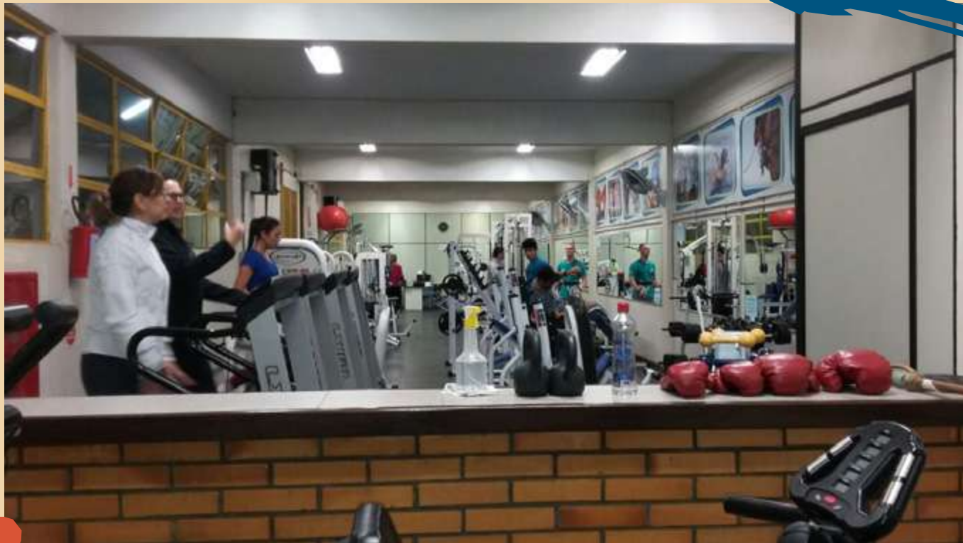
2016 – Laboratório de Exercícios Resistidos - Academia.