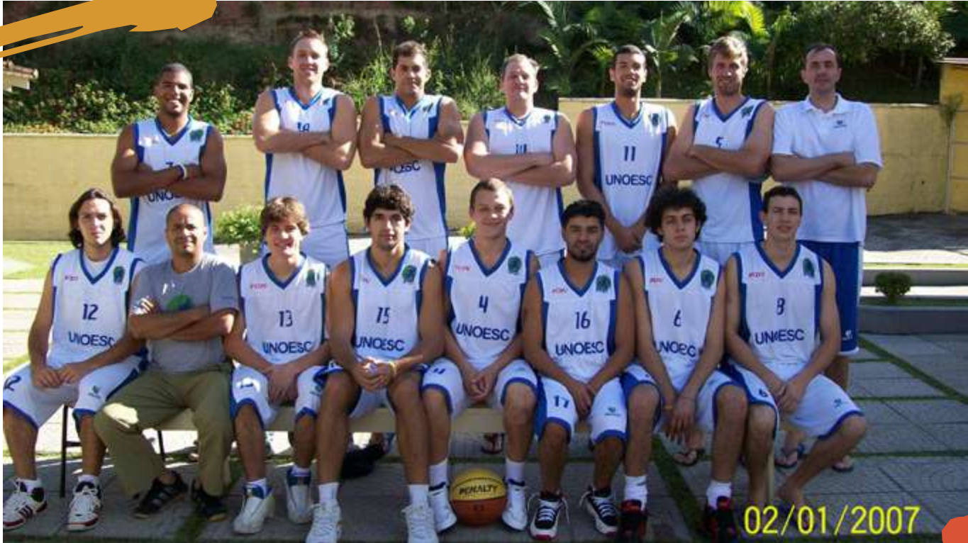
2008 – Equipe de basquetebol masculino. Jogos Universitários Catarinenses, Jaraguá do Sul, SC.