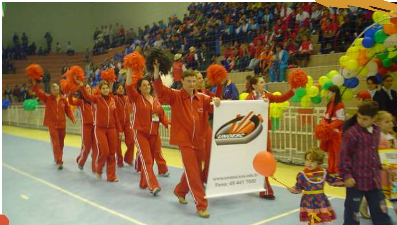
2004 – Cerimonial de Abertura da Cofafe. Joaçaba, SC.