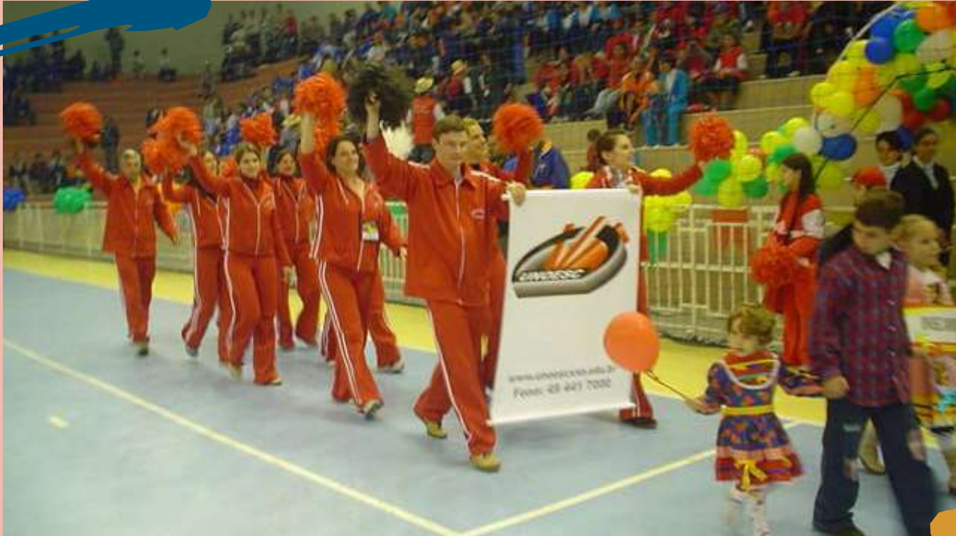
2004 – Realização da 17ª Cofafe (Confraternização Olímpica dos Funcionários das Fundações Educacionais) em Joaçaba.