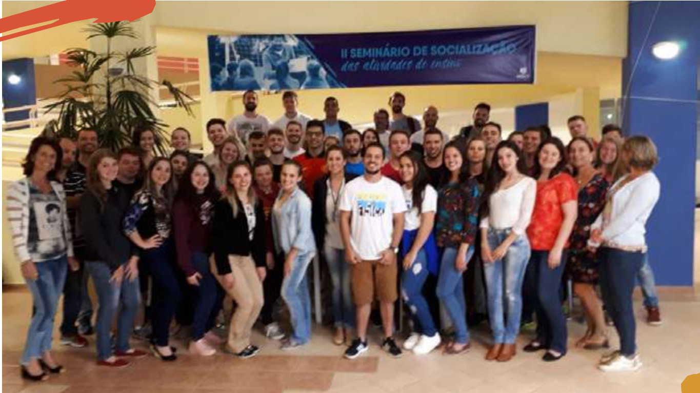
2017/1 – 2º Seminário de Socialização das Atividades de Ensino.