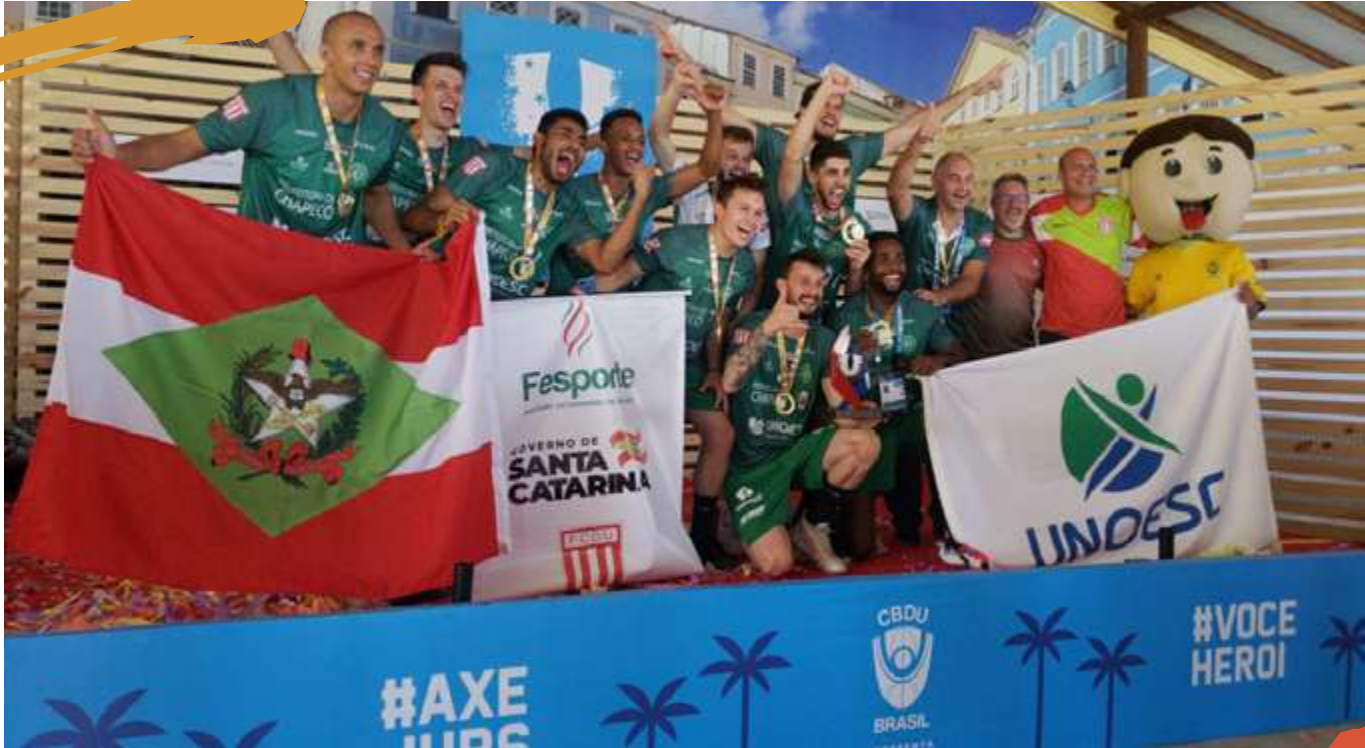
2019 – Equipe de voleibol masculino, campeã dos Jogos Universitários Brasileiros (JUBs). Salvador, BA.