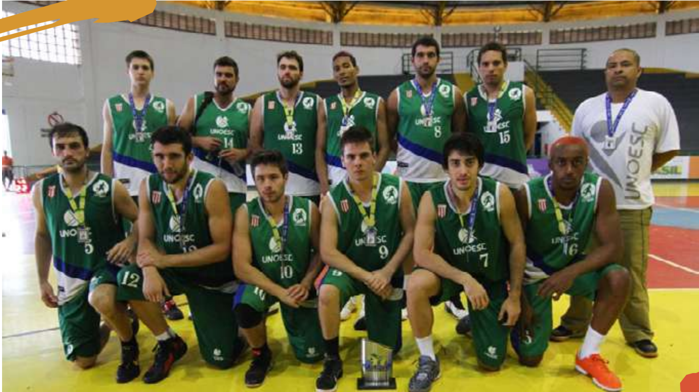
2013 – Equipe de basquetebol masculino, vice-campeã. Liga de Desporto Universitário. Volta Redonda, RJ.