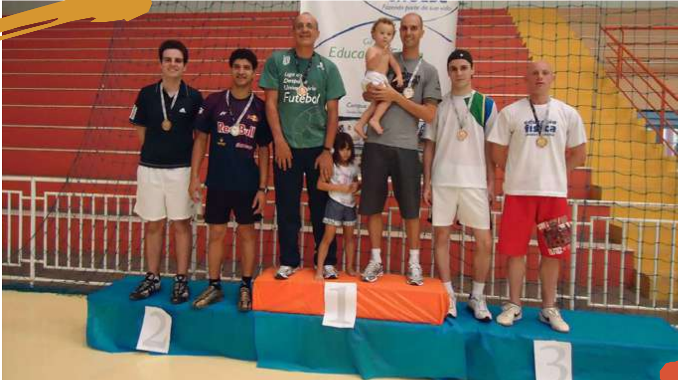
2011 – Festival de badminton. Joaçaba, SC.