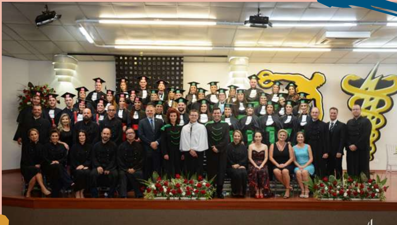
2020 – Turma de diplomados do Curso.