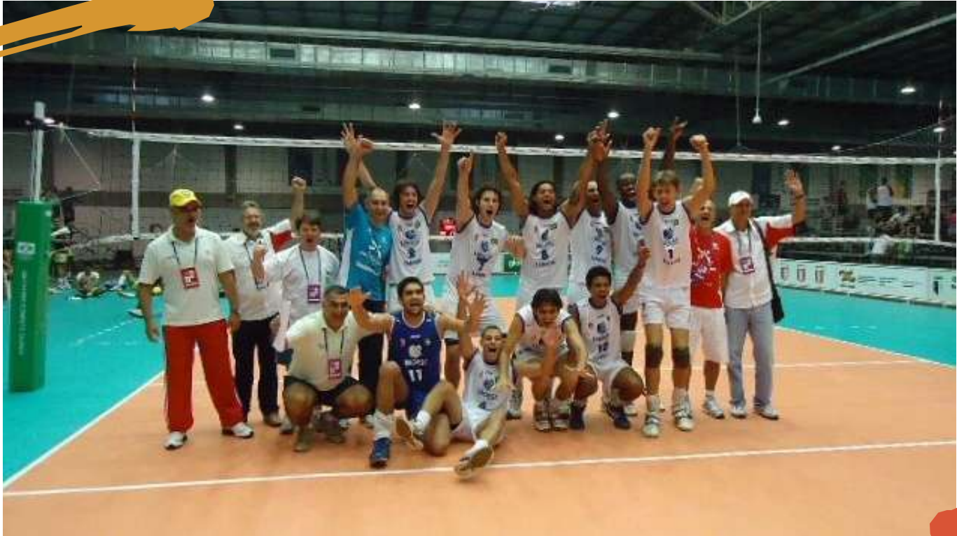
2007 – Equipe de voleibol masculino, campeã nos Jogos Universitários Brasileiros. Blumenau, SC.