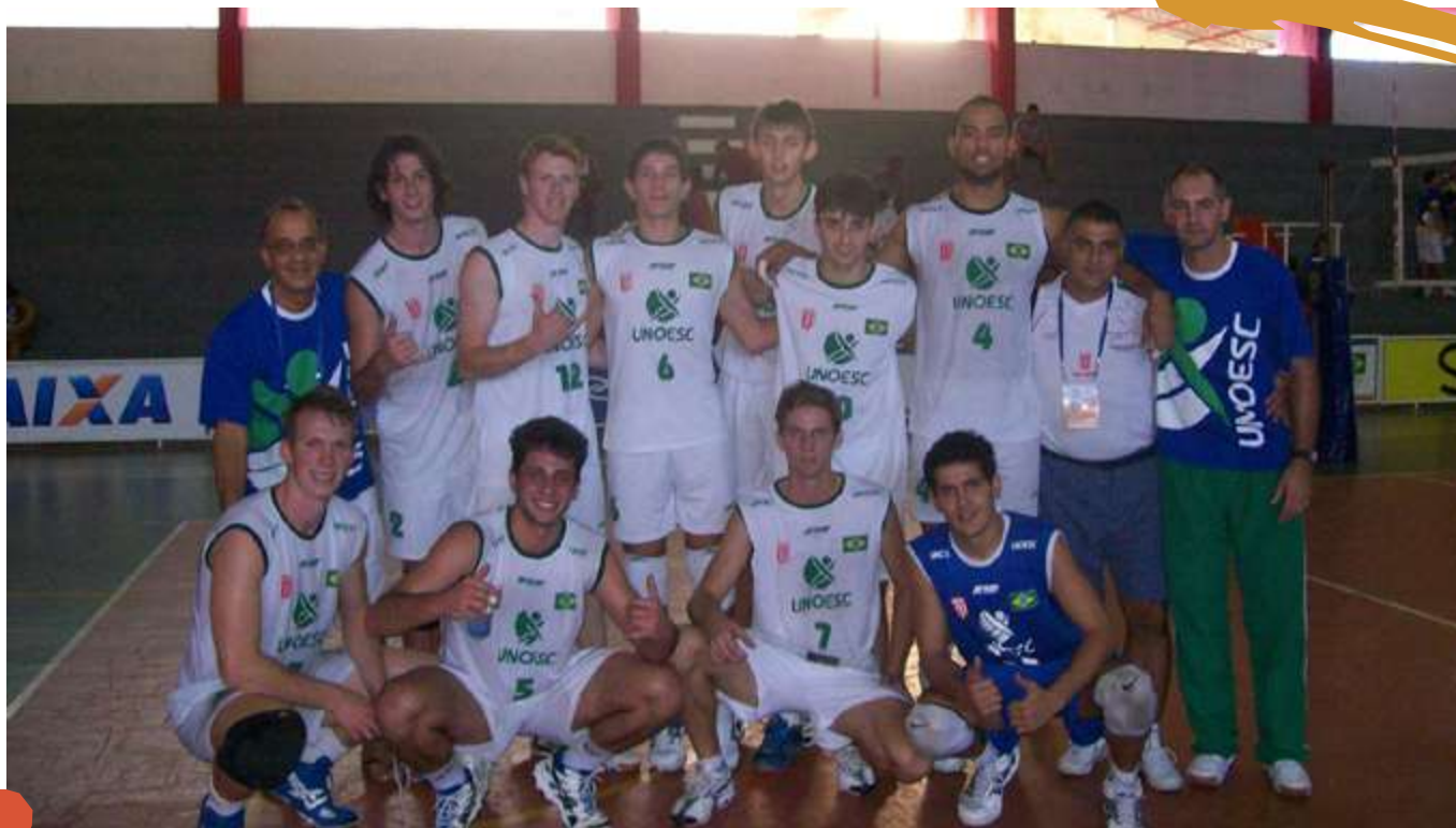
2008 – Equipe de voleibol masculino. Jogos Universitários Brasileiros, Maceió, AL.