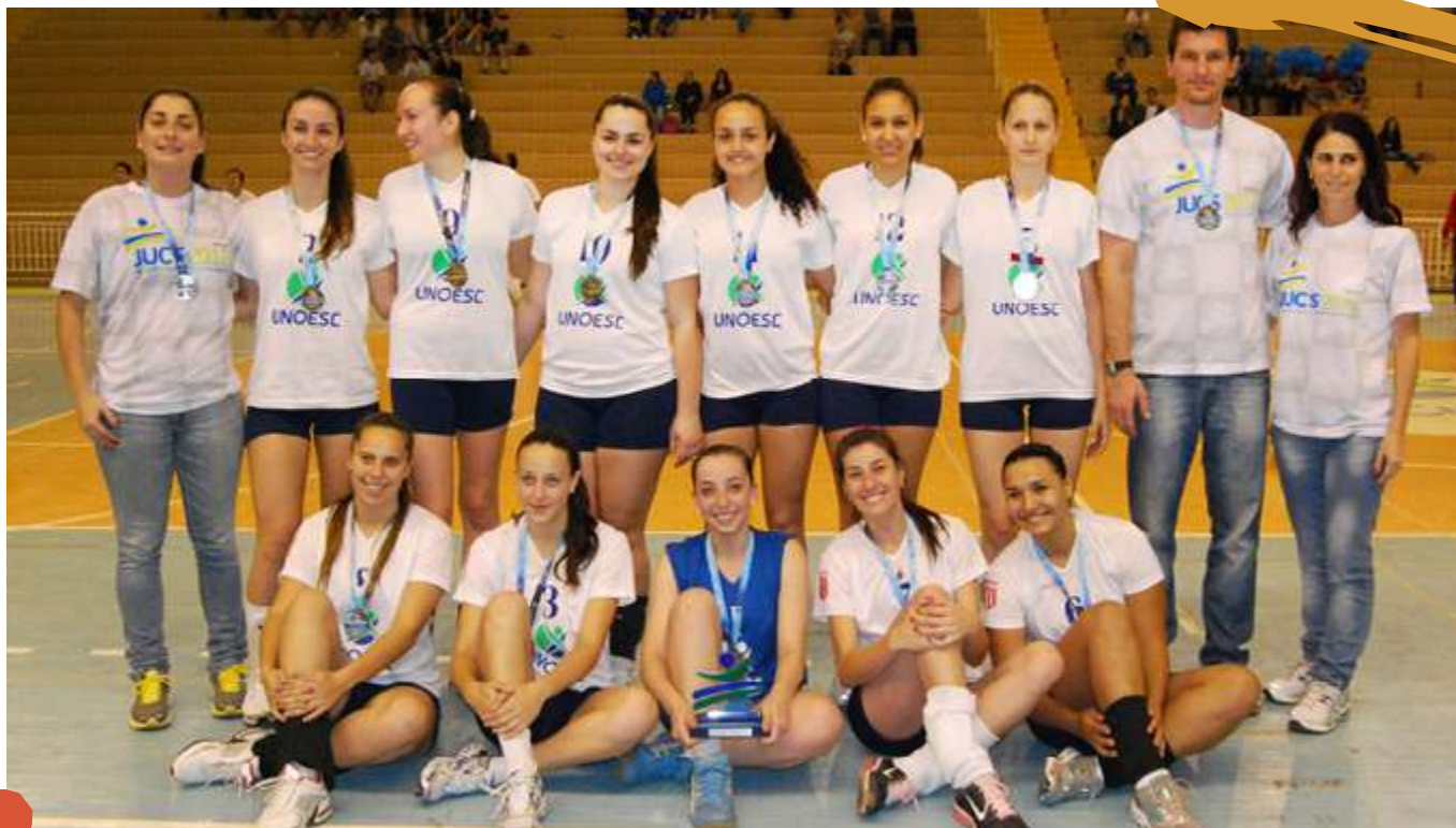
2012 – Equipe de voleibol feminino. Jogos Universitários Catarinenses. Joaçaba, SC.