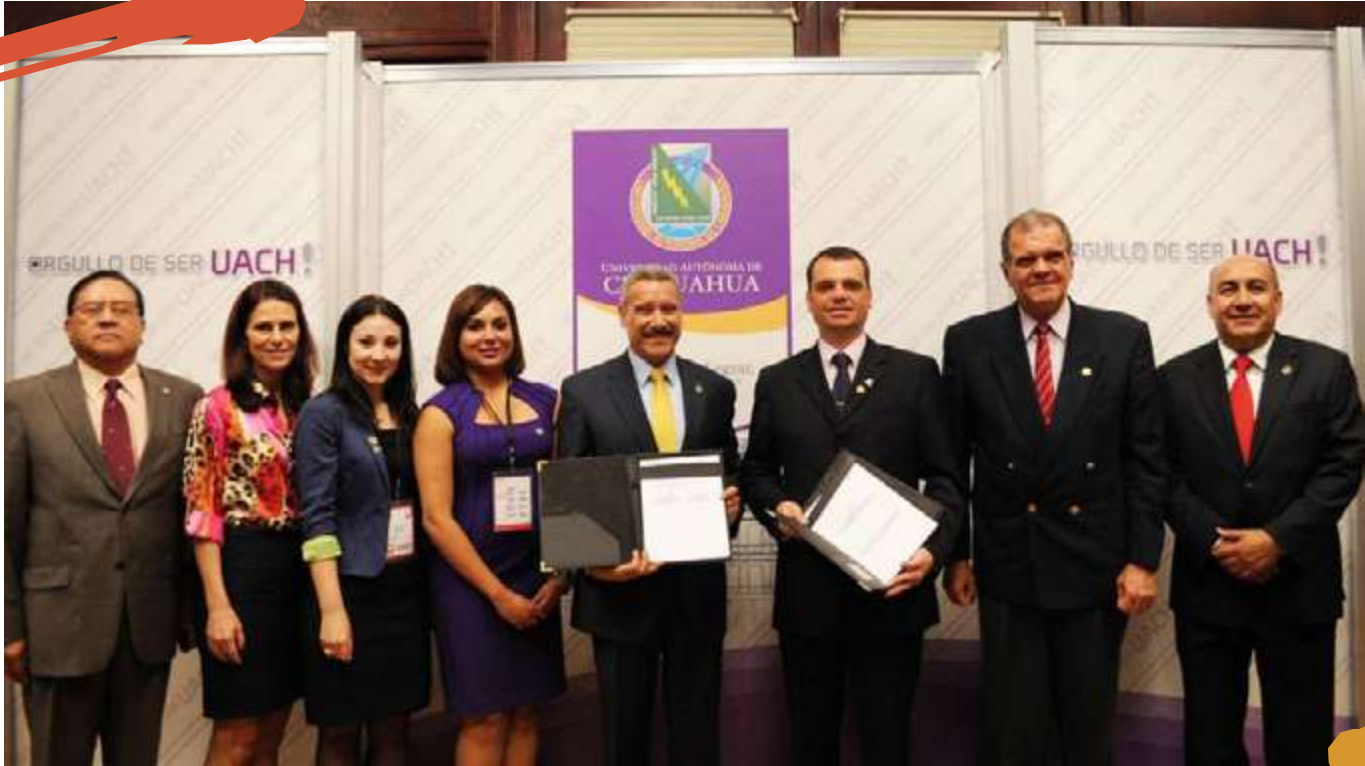
2013 – Assinatura de convênio entre as instituições Universidad Autónoma de Chihuahua (UACH), México e Unoesc.