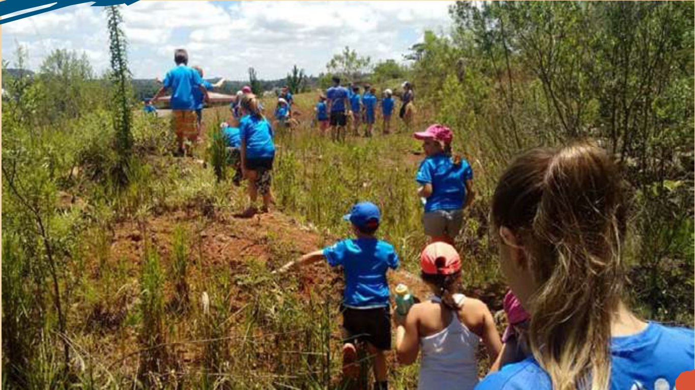
2017 – Colônia de Férias realizada no mês de dezembro.