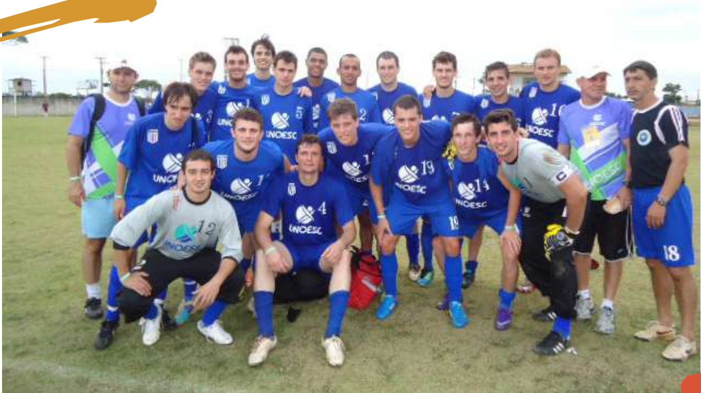
2012 – Equipe de futebol masculino. Liga de Desporto Universitário. Porto Seguro, BA.