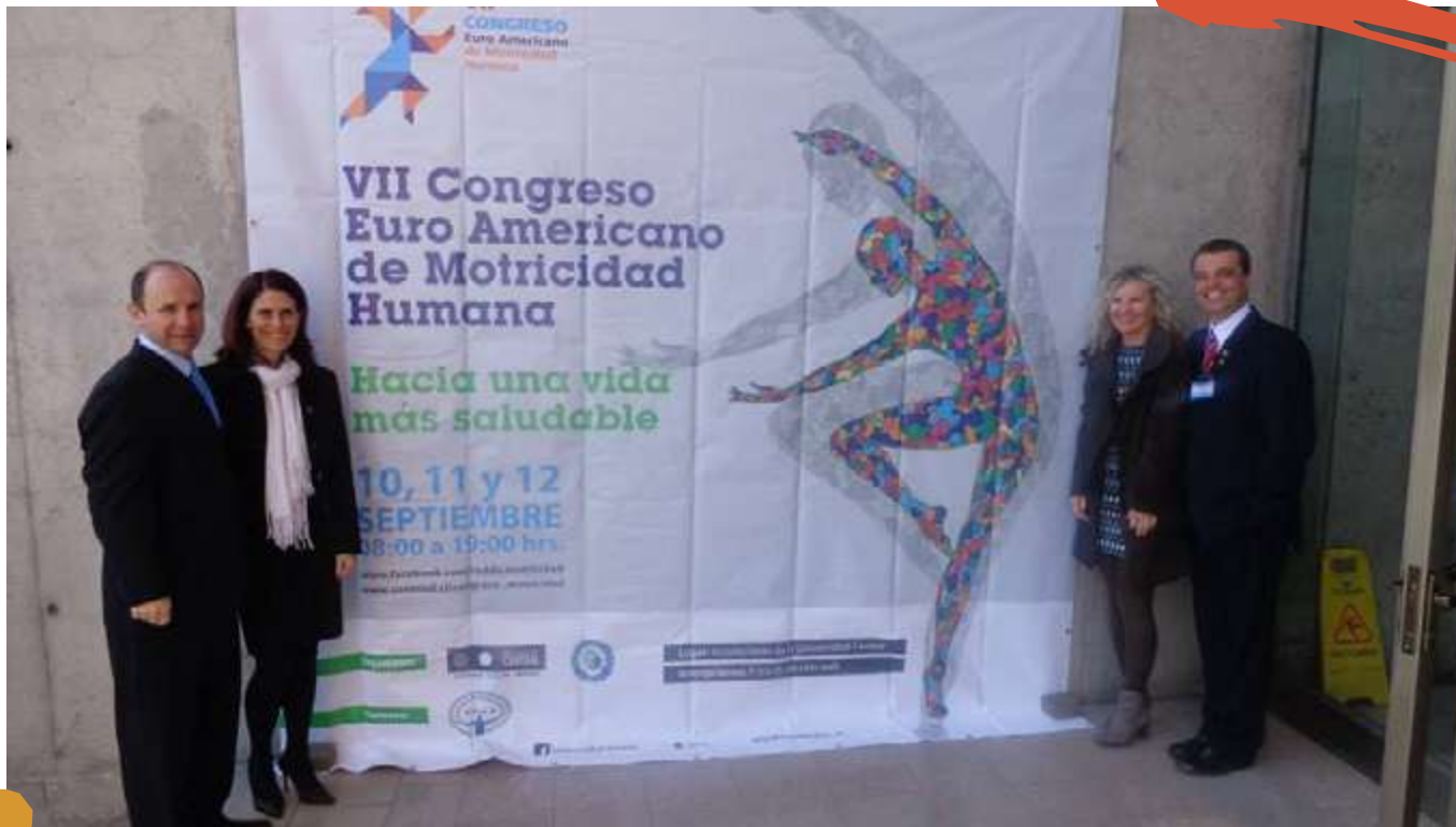
2014 – Participação dos docentes no VII Congresso da International Human Motricity Network (IHMN), realizado na Universidad Central de Chile (UCEN), no Chile.