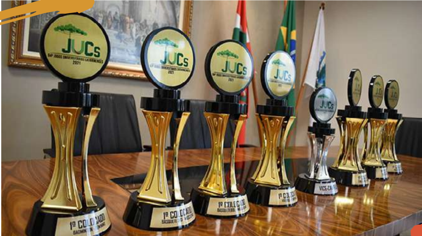
2021 – Premiação conquistada pela Unoesc. Jogos Universitários Catarinenses, Joaçaba, SC.