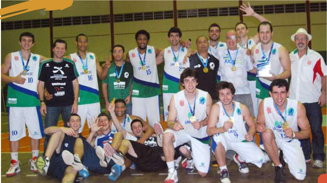
2012 – Equipe de basquetebol masculino, campeã dos Jogos Universitários Catarinenses (JUCs). Joaçaba, SC.