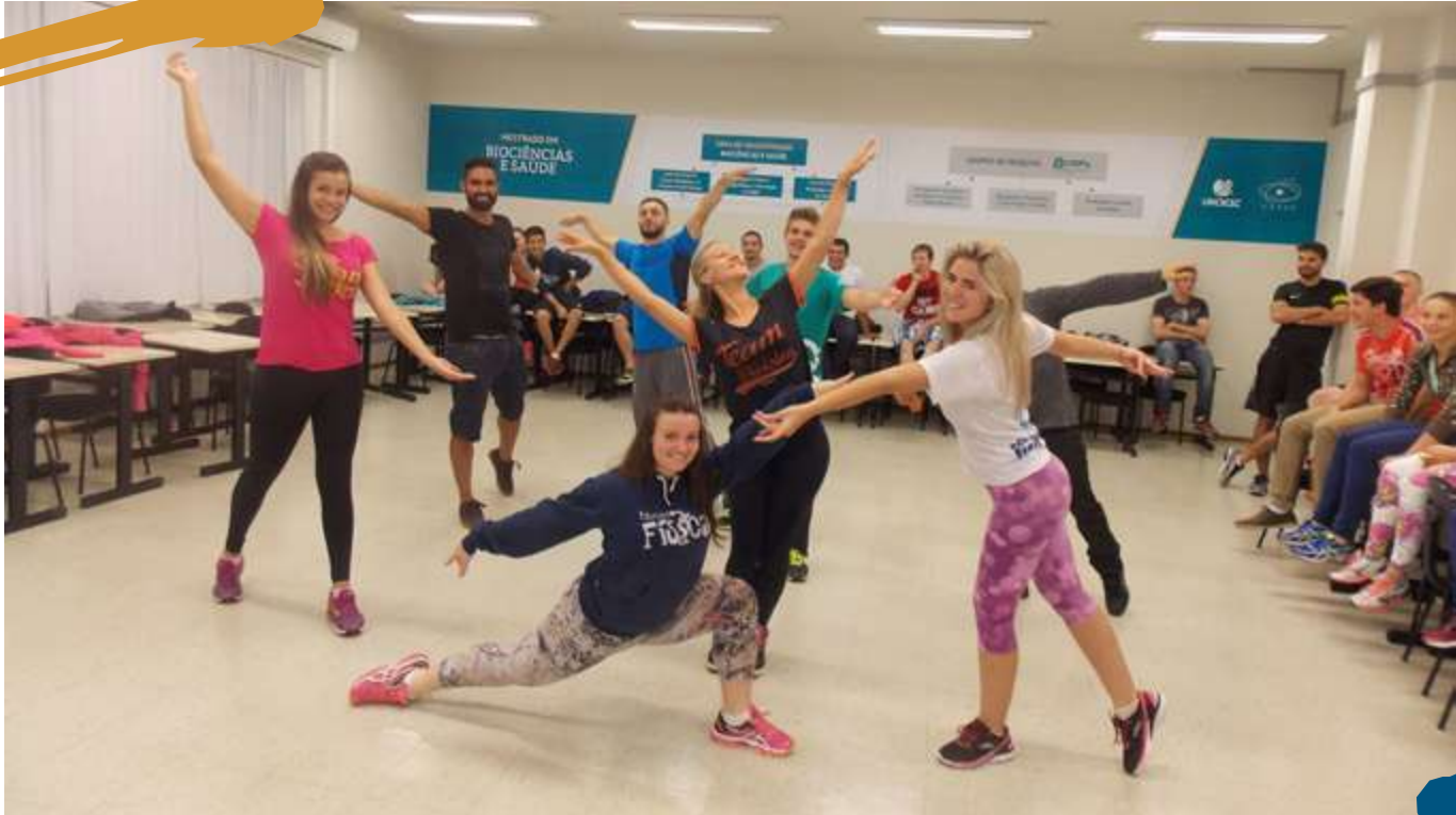
2016 – Corporeidade.