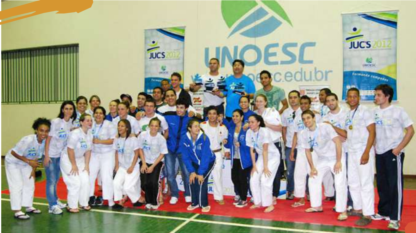
2012 – Equipe de judô. Jogos Universitários Catarinenses. Joaçaba, SC.