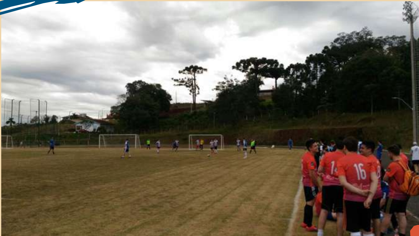
Unoesc Esporte - Atividade Esportiva para alunos da Unoesc.