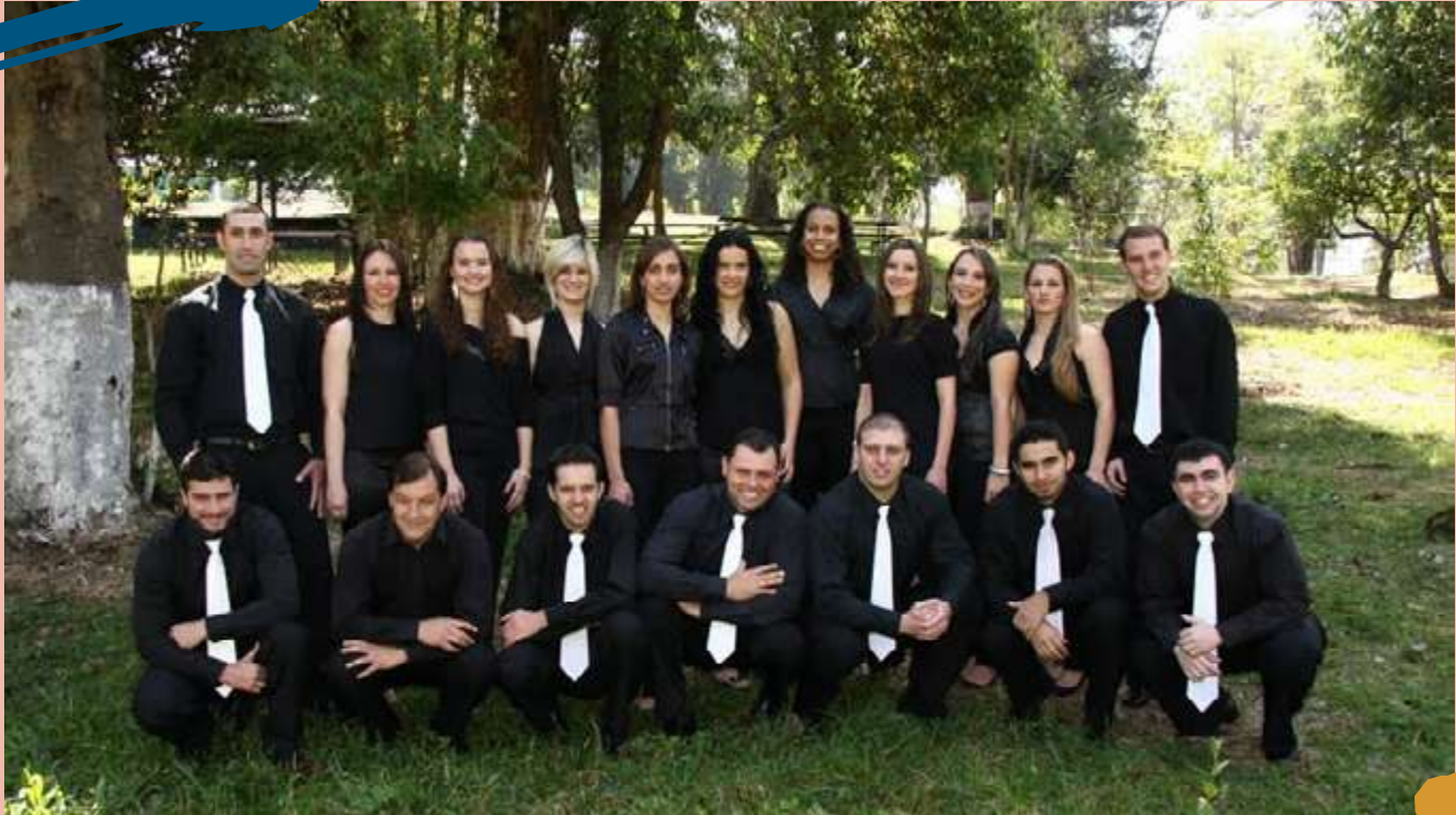
2013 – Turma de diplomados do Curso.