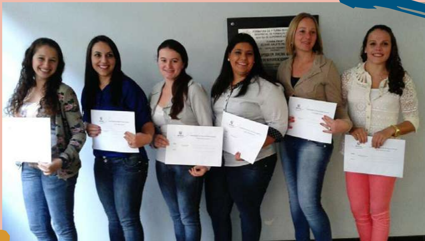
2013 – Turma de diplomados do Curso.