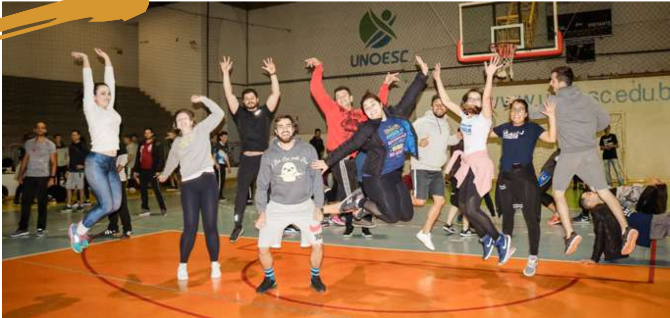
2019 – Corporeidade e Movimento.