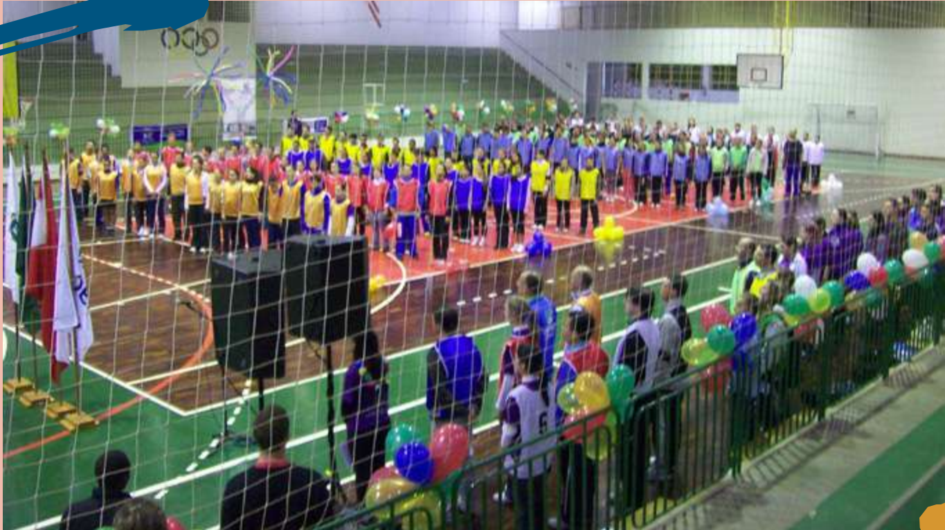
2010 – Realização do 1º Brinca Educação Física, gincana esportivo-cultural envolvendo todos os acadêmicos e professores do Curso.