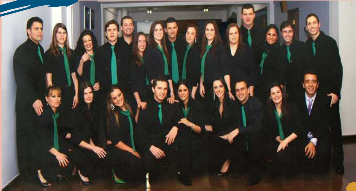
2009 – Turma de diplomados do Curso, 2º semestre.