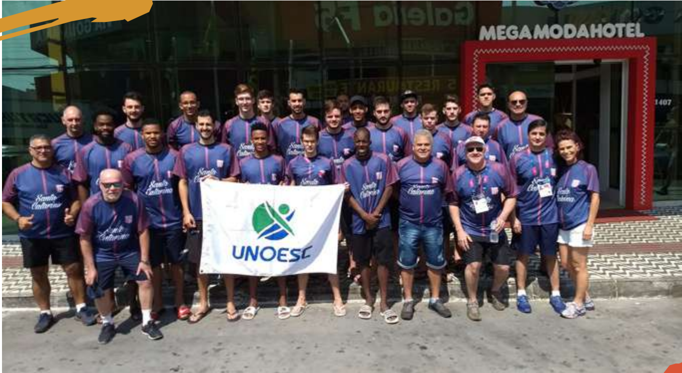
2017 – Delegação da Unoesc. Jogos Universitários Brasileiros, Goiânia, GO.