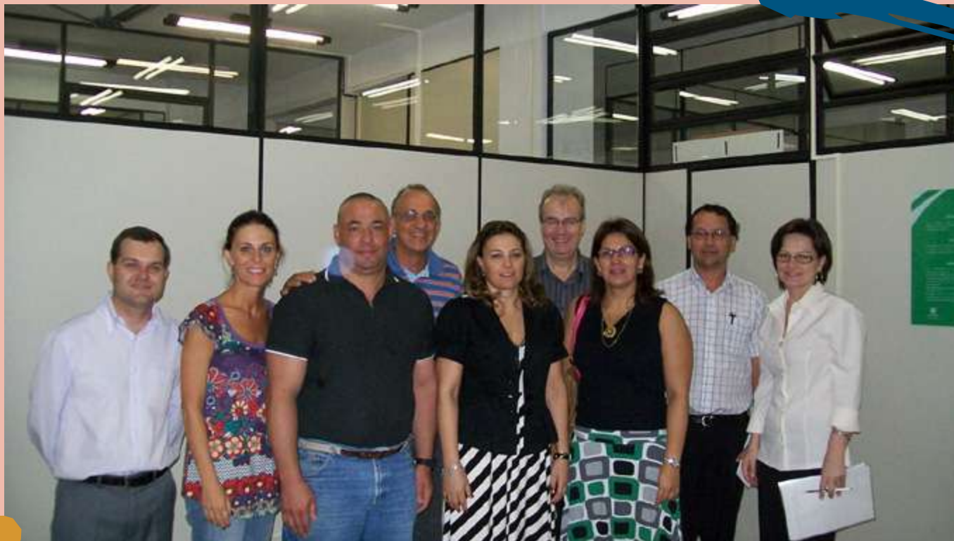
2005 – Reconhecimento do Curso de Educação Física.