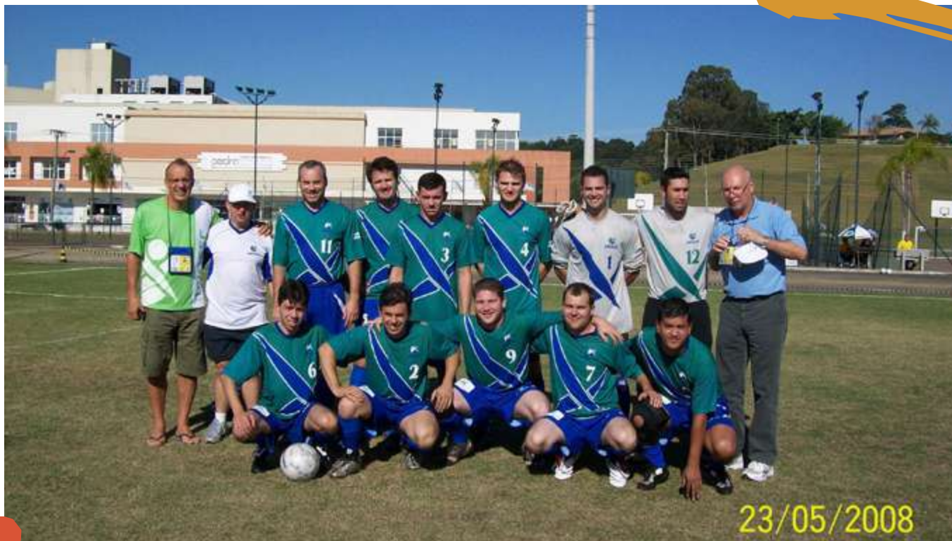
2008 – Equipe de suíço livre masculino. Cofafe, Unisul Pedra Branca, Palhoça, SC.