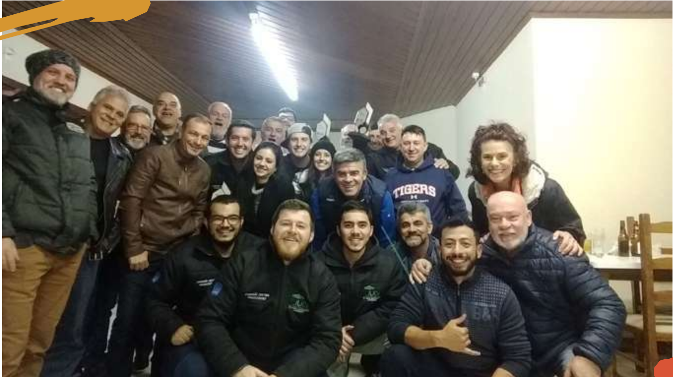
2018 – Equipe de professores e colaboradores. Jogos Universitários Catarinenses, Lages, SC.